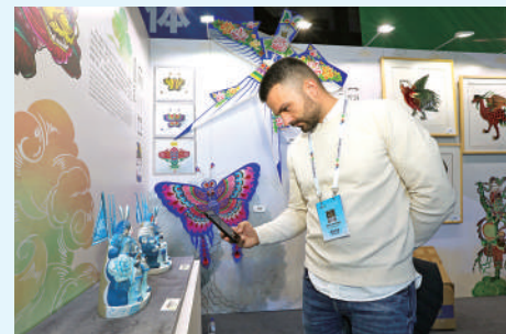
11月1日，北京首钢园，2023年世界青年发展论坛青年文化创新主题论坛，会议间隙，一名外国青年代表参观非遗文化展览。

汤恩平建议年轻人多从事科学研究，更好地发挥自己的创造力，促进文化交流与创新。“教育和科学总能扩大我们的视野，我们的视野越宽广，就越能为我们的国家作出更好的贡献，推动文化创新和科学的发展。” “培养青年的创意潜力是共同目标” 29岁的新加坡女孩黄丝敏则致力于帮助年轻艺术家将好的文化创意“落地”。黄丝敏是一名音乐创作者，她写歌也唱歌。她发现，很多和自己一样的年轻人有好的文化创意，但实现它却是一个难题。2021年，她所在的“艺术之浪”工作室决定发起“100位创意者计划”项目，为拥有创意的年轻人提供经验分享、技能培训和创新支持。“指导和分享更多年轻人追求理想，无论其理想是大是小。” 为此，黄丝敏通过网络招募青年，他们中有许多艺术家。工作室积极吸取创意行业好的思路和提案，还把艺术家