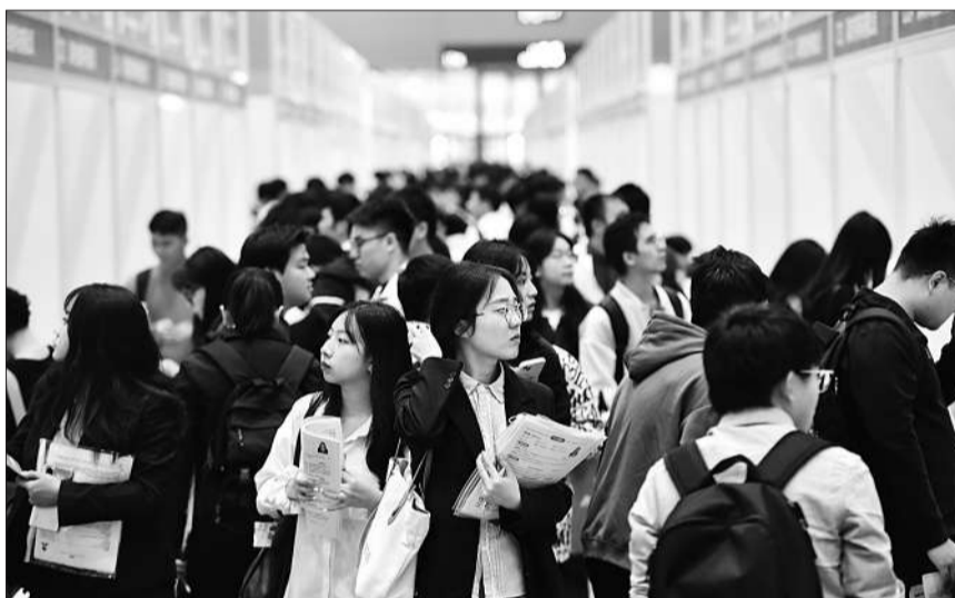
11月22日，求职者在招聘会现场寻找心仪的岗位。当日，第二届全国人力资源服务业发展大会在深圳国际会展中心开幕。作为大会的重头活动之一，2023年粤港澳大湾区人才专场招聘会暨第27届全国高校毕业生秋季就业双选会同步举办，超过1200家企业参展，共提供约5万个岗位。