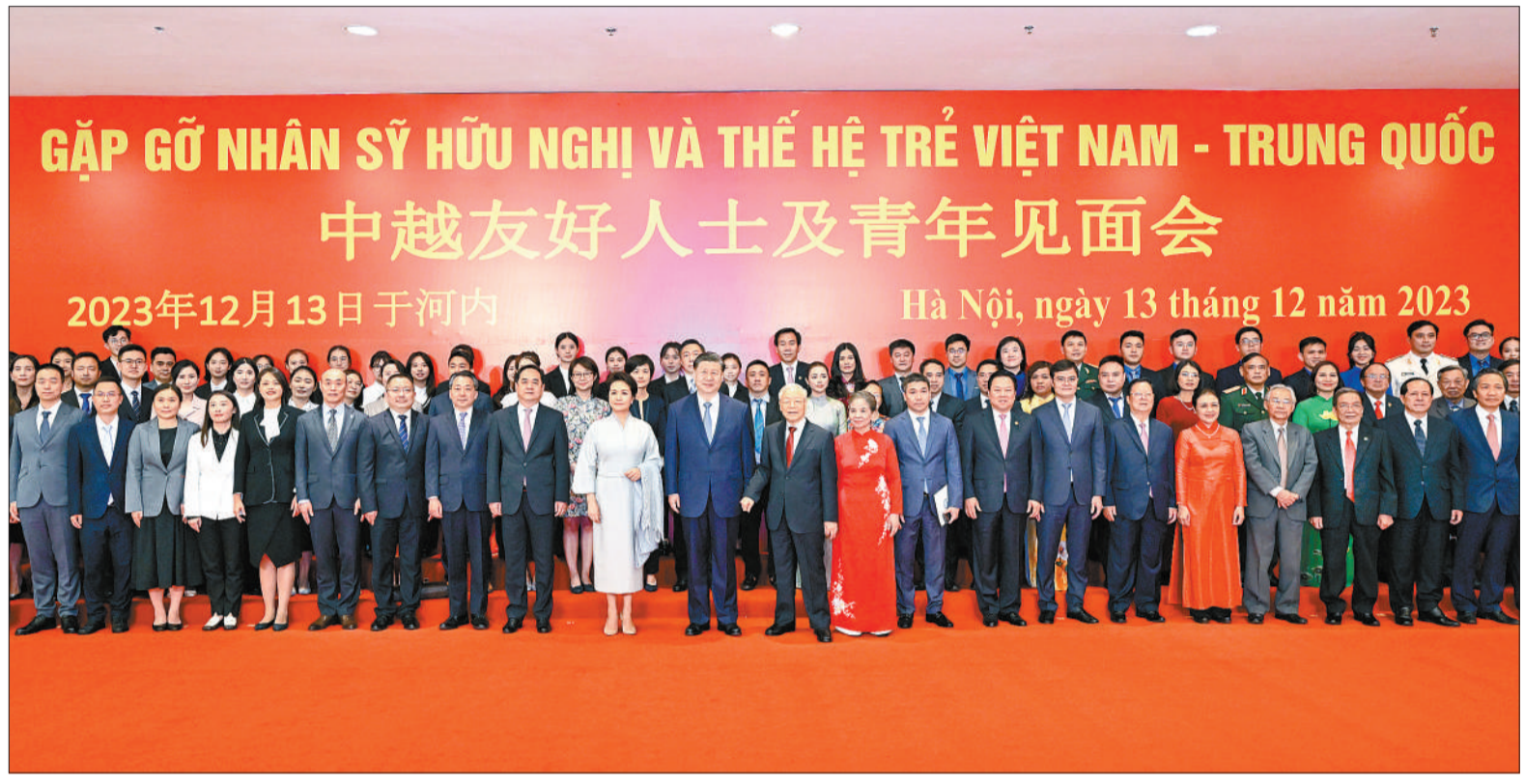
当地时间12月13日下午,中共中央总书记、国家主席习近平和夫人彭丽媛在河内同越共中央总书记阮富仲夫妇共同会见中越两国青年和友好人士代表。这是习近平夫妇和阮富仲夫妇同中越两国青年和友好人士代表亲切合影。

新华社河内12月13日电(记者倪四义 宿亮 孙一)当地时间12月13日下午,中共中央总书记、国家主席习近平和夫人彭丽媛在河内同越共中央总书记阮富仲夫妇共同会见中越两国青年和友好人士代表。习近平和彭丽媛抵达国家会议中心时,受到越方青年代表热烈欢迎。习近平夫妇和阮富仲夫妇同中越两国青年和友好人士代表亲切合影。中越友好人士及青年见面会现场气氛热烈,鲜花和两国国旗交相辉映,汇成一片喜悦的海洋。在热烈的掌声中,习近平发表题为《赓续传统友谊,开创中越命运共同体建设新征程》的重要讲话。习近平代表中国党和政府向致力于中越友好的新老朋友致以亲切问候。习近平指出,昨天,我同阮富仲总书记一道宣布构建具有战略意义的中越命运共同体,开启了中越两国关系发展新阶段,这是我们从振兴世界社会主义和实现中越两国长治久安出发作出的重大战略决策,深深植根于中越传统友好,符合两国人民共同利益和共同愿望。回首过去,我们志同道合、守望相助。近代以来,中越两党和两