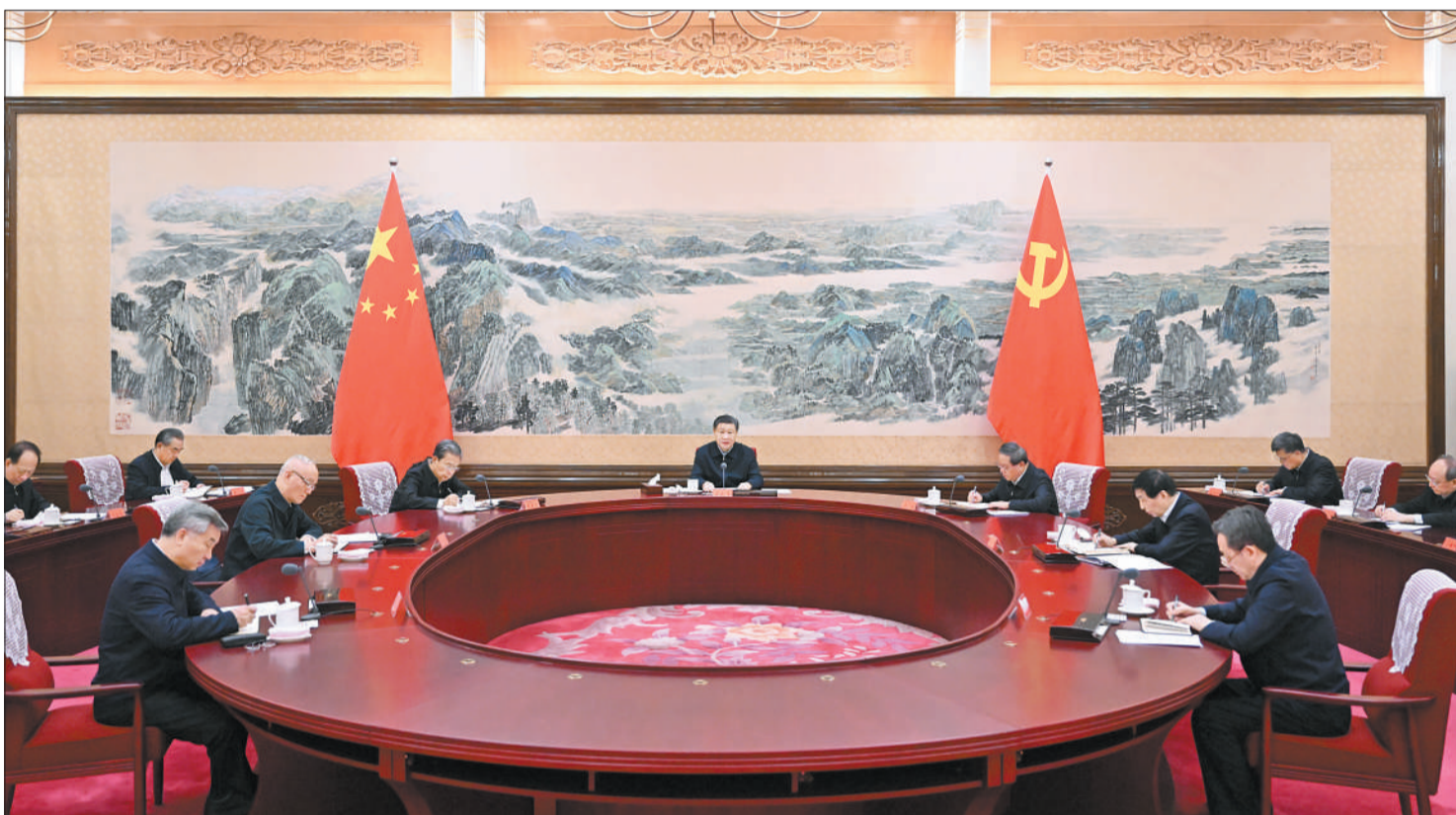
12月21日至22日，中共中央政治局召开学习贯彻习近平新时代中国特色社会主义思想主题教育专题民主生活会，中共中央总书记习近平主持会议并发表重要讲话。

新华社北京12月22日电 中共中央政治局于12月21日至22日召开学习贯彻习近平新时代中国特色社会主义思想主题教育专题民主生活会，聚焦学思想、强党性、重实践、建新功总要求，对照凝心铸魂筑牢根本、锤炼品格强化忠诚、实干担当促进发展、践行宗旨为民造福、廉洁奉公树立新风具体目标，按照以学铸魂、以学增智、以学正风、以学促干重要要求，联系中央政治局工作，联系带头旗帜鲜明讲政治、带头学懂弄通做实习近平新时代中国特色社会主义思想、带头贯彻党中央决策部署、带头践行宗旨为民造福、带头履行全面从严治党责任等方面的实际，总结成绩，查摆不足，进行党性分析，开展批评和自我批评。