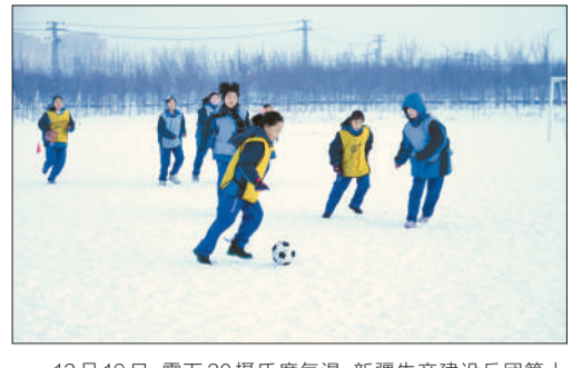
12月19日，零下20摄氏度气温，新疆生产建设兵团第十二师头屯河农场学校里，一群学生正在玩雪地足球。