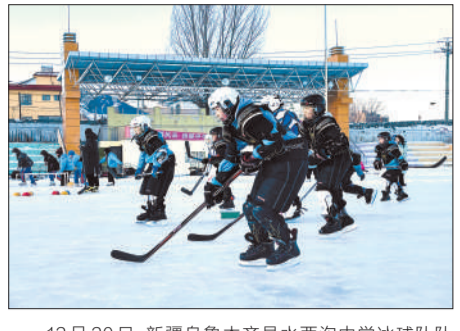
12月20日，新疆乌鲁木齐县西沟中学冰球队队员正在打冰球。