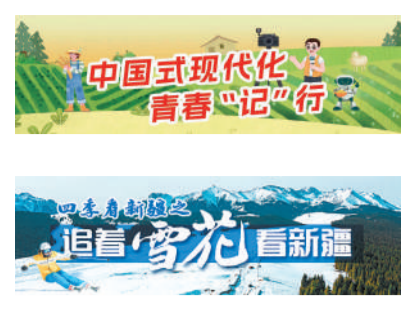
中国青年报·中青网记者 焦敏龙 王雪迎 陈卓琼 朱洪园 见习记者 尹希宁