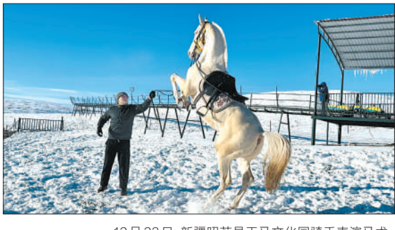
12月23日，新疆昭苏县天马文化园骑手表演马术。