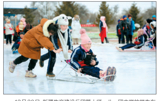
12月20日，新疆生产建设兵团第十师一八一团中学的学生在体验雪爬犁等冰雪趣味运动。