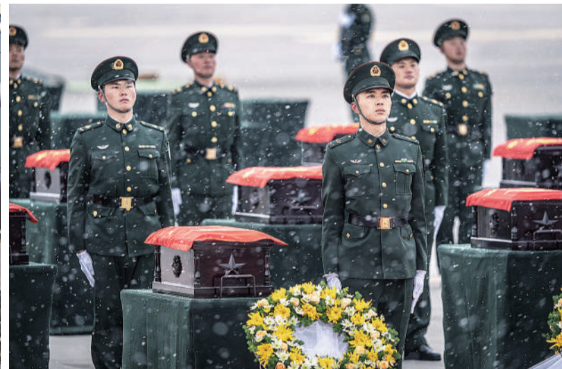
烈士回家 11月23日,辽宁沈阳桃仙国际机场,第十批在韩中国人民志愿军烈士遗骸迎回仪式现场,礼兵战士在风雪中迎回烈士的遗骸。 中青报·中青网记者 李隽辉/摄