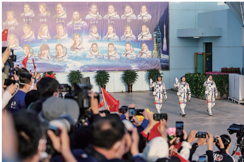
逐梦苍穹 5月30日早晨,甘肃酒泉,神舟十六号载人飞行任务航天员乘组出征仪式在酒泉卫星发射中心问天阁圆梦广场举行,3名航天员景海鹏(中)、朱杨柱(右)、桂海潮准备参加出征仪式。