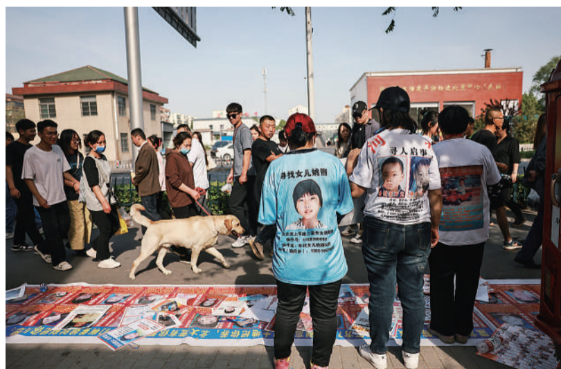
淄博寻亲 5月1日,山东淄博,人来人往的八大局便民早市旁,几位母亲在街头宣传寻亲信息,吸引来往的游人。她们来到淄博不为烧烤,而是为了人们的注意。