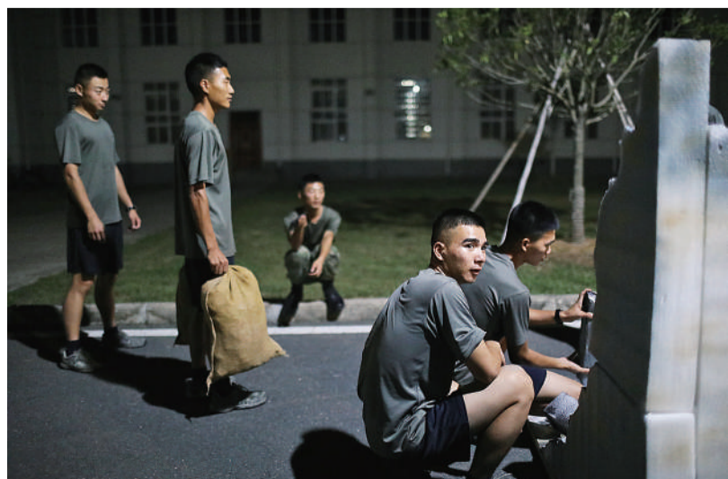
英雄传人 8月15日晚,空军空降兵某部“模范空降兵连”,战士们准备排练抗震救灾题材的情景剧。该连队是黄继光生前所在连队,2008年汶川大地震,该连队是最先抵达灾区的部队之一。