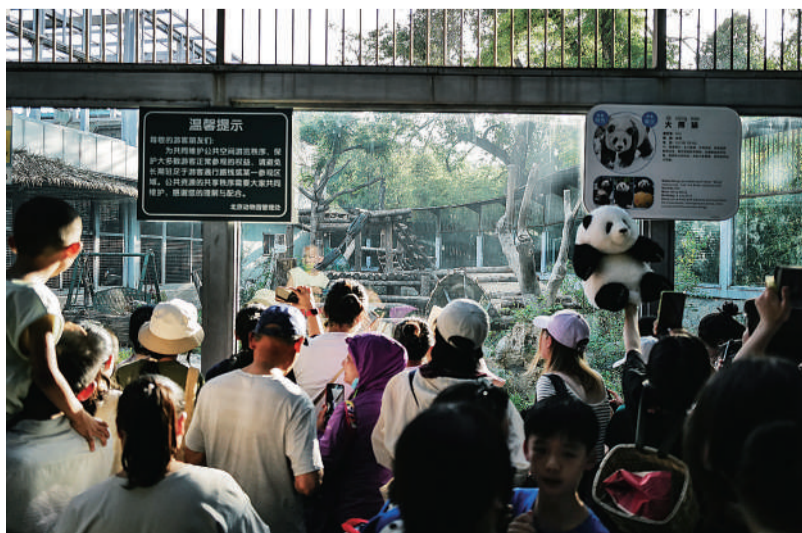
等待萌兰 7月4日,北京动物园,观众在等待大熊猫萌兰,但直到闭园也没能看到它走出室外。当天,大熊猫萌兰迎来8岁生日,不少市民游客前来为它庆生。