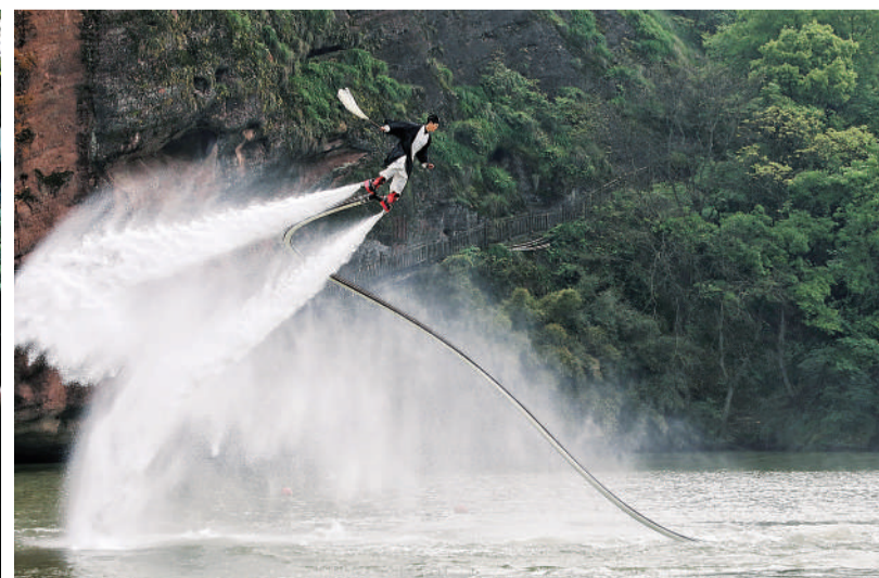
我心飞翔 4月13日,江西鹰潭,龙虎山景区,一名身着古装的演员在水上表演。来自文化和旅游部的相关数据显示,今年前三季度,国内旅游达到36.7亿人次,实现旅游收入3.7万亿元,同比分别增长75%、114%。