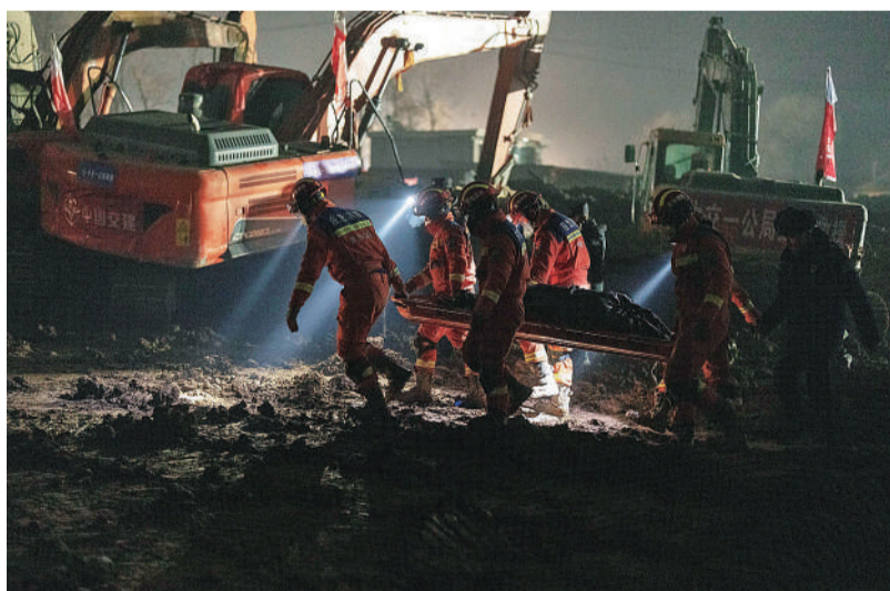
寒冬震后 12月21日晚,青海省海东市乐都区中川乡金田村,救援人员在抢险救灾中。12月18日23时59分,位于青海和甘肃交界之地的甘肃临夏积石山县发生6.2级地震,地震及其引发的次生灾害造成百余人遇难。