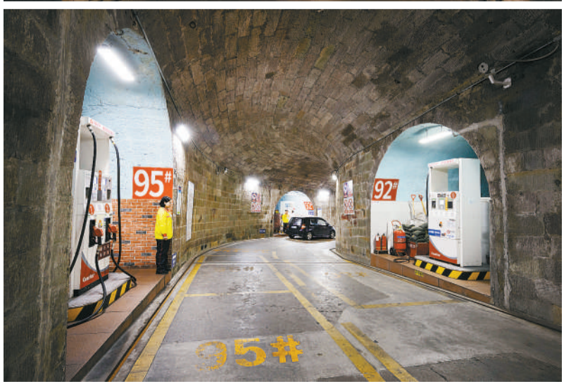
2023年11月8日,重庆桂花园加油站,加油机分置洞壁两侧,车辆从防空洞口驶入洞内加油,再从另一边洞口驶出。