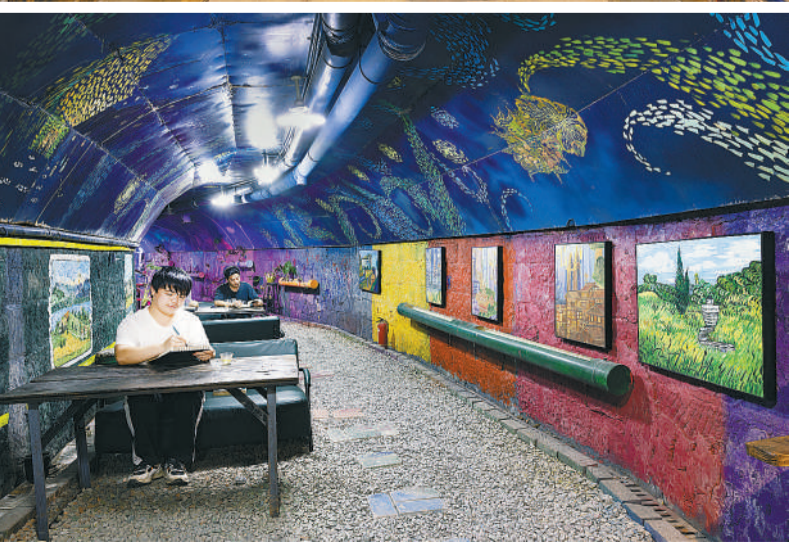
2023年11月9日,重庆“石头房子艺术空间”,用涂鸦、绘画、灯光等元素打造的空间吸引着众多市民前往看书、喝茶、赏画。