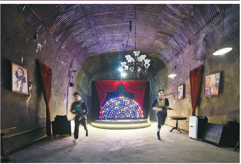
2023年11月26日,重庆,市民在防空洞内体验射击竞技游戏。