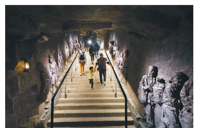
2023年11月26日,重庆,市民参访重庆大轰炸惨案遗址。1941年6月5日,抗日战争时期,日军对重庆进行轰炸,市民大量涌入较场口防空大隧道,导致了“六·五”隧道窒息惨案。如今,这里已成为当地的国防教育基地。

跃成为新的热门地标和休闲打卡地,年均游客量已突破100万人次。在重庆加快建设国际消费中心城市的背景下,“洞穴经济”日渐成为这座“网红”城市文旅发展的新亮点。本地人的生活也因洞穴的升级而更加便利,一大批防空洞变身成为纪念馆、博物馆、便民通道、书屋、艺术空间等民生和文化载体,成为造福山城百姓的重要设施。 这些蜿蜒于地下的防空洞,为网友口中的“八维城市”又增加了活化历史资源、传承城市文脉的新维度,让重庆的城市功能进一步得到完善。洞穴里的故事,还将继续讲下去。