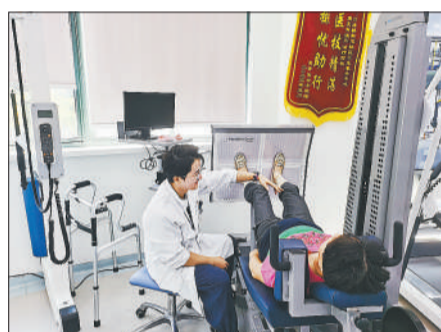
上海市黄浦区打浦桥街道社区卫生服务中心，康复治疗师在为患者进行康复训练。