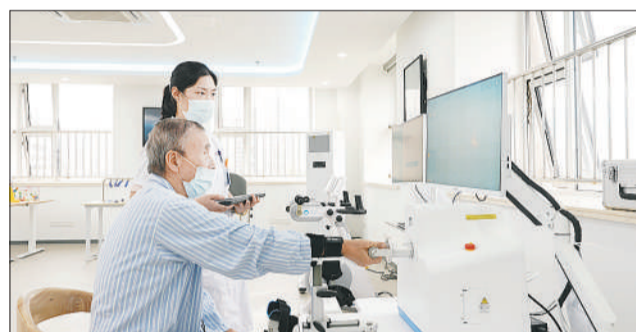
上海市浦东新区三林康德社区卫生服务中心康复科，一位老年患者在康复治疗师的指导下进行康复训练。