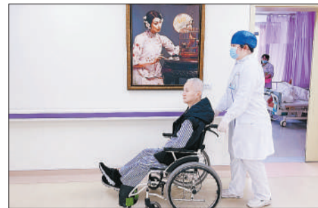
上海市黄浦区打浦桥街道社区卫生服务中心，护士推着病人在挂着名画的病区走廊散步。