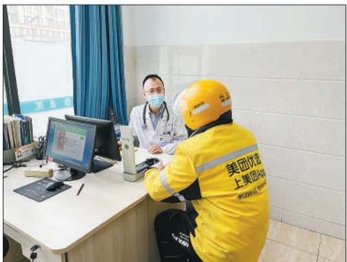
昌城医院新就业群体专属医生团队成员、内科主治医师正在接诊一名“小哥”。

150元)，确需椎间孔镜微创治疗者，减免手术费500元；每年由公司评选出前50名优秀骑手，医院免费提供不低于300元的健康体检套餐；公布健康咨询热线，常态化提供健康咨询。