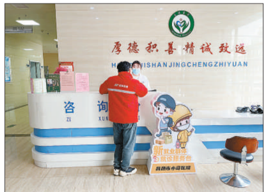
在昌城医院里，有“小哥”专属的“新就业群体就诊服务台”。