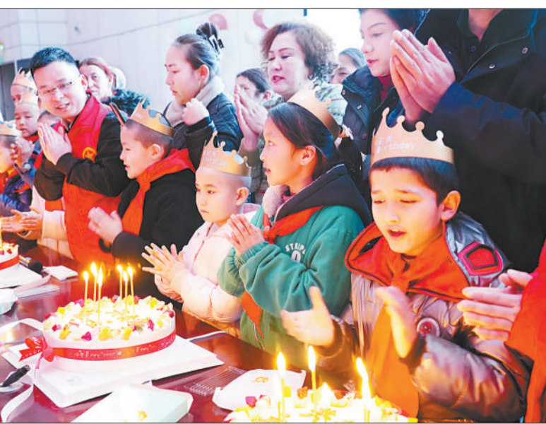
1月23日，新疆维吾尔自治区阿克苏地区乌什县发生7.1级地震，共青团乌什县委迅速行动，积极组织团员和青年志愿者参与抗震救灾行动中。1月25日21时，在乌什县第四中学安置点，共青团乌什县委组织了一场特殊的爱心生日会，为受灾少年儿童送去温暖和关爱。

接下来，如何让“青年优居计划”更好发挥作用？对此，山东省政协共青团和青联界别在去年的联名提案中提出3点可行性建议：进一步加强住房保障体系建设。（下转2版）