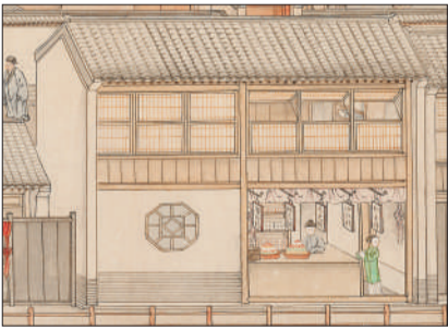
茶食店及“薄荷糕”“状元饼”“太史饼”“沙仁糕”“松子饼”招牌(《乾隆南巡图》第六卷局部)。

《乾隆南巡图》共有12卷,加起来有150多米长,通览画作全部,不难发现画卷有水。这些大自然中无形的、流动的液体到了画面上,则变成了空间布白的区域,也被赋予不同的肌理。画师通过长短不一、弧度不同的淡墨勾勒,描绘出南巡沿途的黄河、淮河、大运河、长江、西湖、南湖等不同的水景。