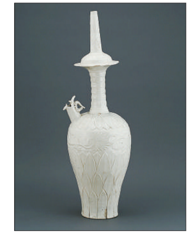
北宋定窑白釉刻莲花瓣纹龙首净瓶。