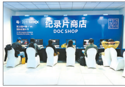
纪录片商店。

谈及纪录片对于自身的意义，朱芳正提到，其实最重要的就是你体验了一种完全没有接触到的生活，在这个过程中发现了一些值得被记录的人和事，然后将他们记录下来。朱芳正开始记录的欲望是在看到这些人和事的时候被激发出来的，这种欲望会驱使他去拍摄、去挖掘、去寻找。“记录本身就具有意义，特别是对于这样一个时代下的这样一群年轻人。”