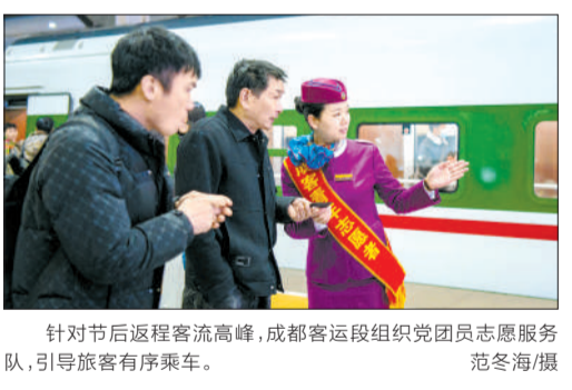
针对节后返程客流高峰，成都客运段组织党员团员志愿服务队伍，引导旅客有序乘车。