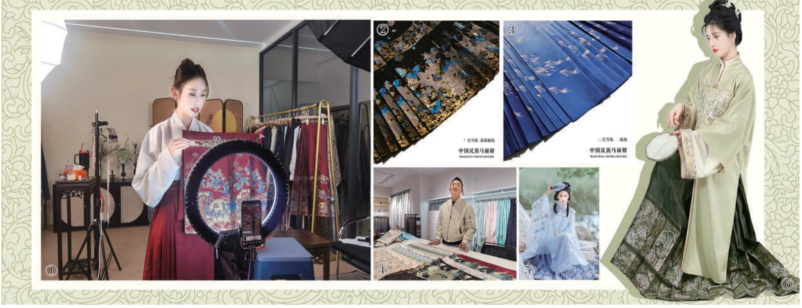
①晚上9点多，浙江海宁许村镇，一家年轻设计师品牌店正在进行马面裙直播，裙子的图案是中国传统中草药。 ②海宁某纺织企业从生产窗帘布转型为生产马面裙面料，企业主介绍传统和现代风格图案的产品。 ③④⑤刘雯设计的马面裙。

龙年春节，马面裙忽然成为服装单品的爆款。在年轻人喜欢的短视频和自媒体平台上，马面裙俨然成为“流量密码”，许多知名博主、大V都穿着它去打卡文物古迹和热门景点。某知名短视频平台发布的报告显示，2023年，该平台用户在超过90个海外国家和地区，发布了与马面裙相关的内容。马面裙成为中国文化出海的一个典型案例。 马面裙的火爆，也让浙江海宁许村镇“出圈”了。来自杭州四季青服装批发市场、“宇宙中心”山东曹县甚至海外的客户，纷纷前来这个小城镇寻找马面裙的主要原料——提花布料。许村镇是国内最大的提花面料基地、产销中心之一。有商家说，只需给张设计图，许村镇就能知道他们想要的面料以及相关生产工艺。