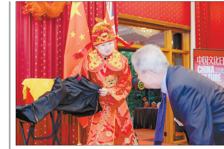
2月27日，在澳大利亚堪培拉中国驻澳大利亚大使馆，来自西安的艺术家表演魔术。中国驻澳大利亚大使馆27日在澳大利亚首都堪培拉举办“中国文化日”活动，邀请来自西安的艺术家展示丰富的中国文化，包括书法、印章雕刻、舞蹈、音乐、秦腔和魔术表演等。