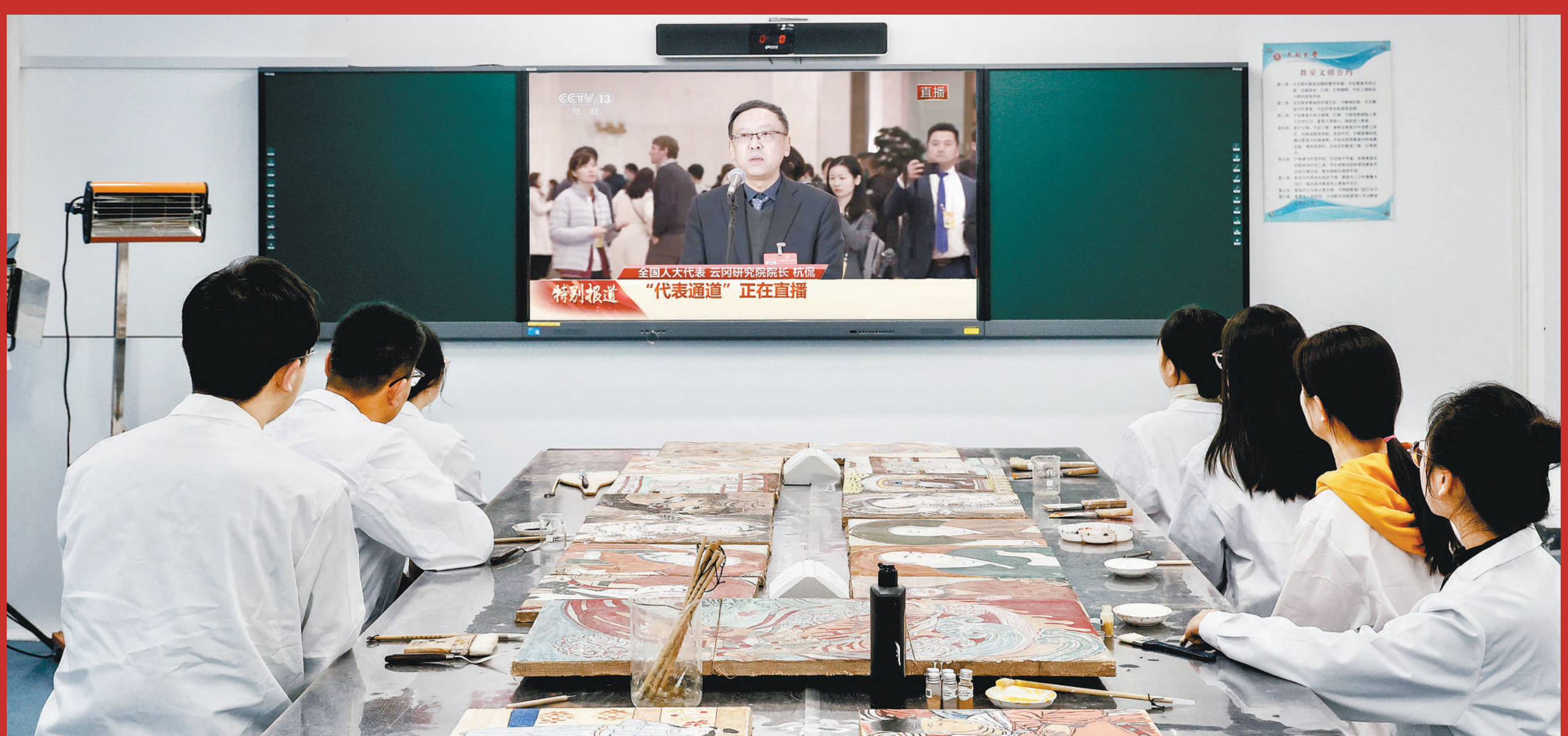
3月5日，山西大同大学云冈学院古代壁画修复实验室内，文物保护技术专业学生收看了全国人大代表、云冈研究院院长杭侃在“代表通道”的采访。