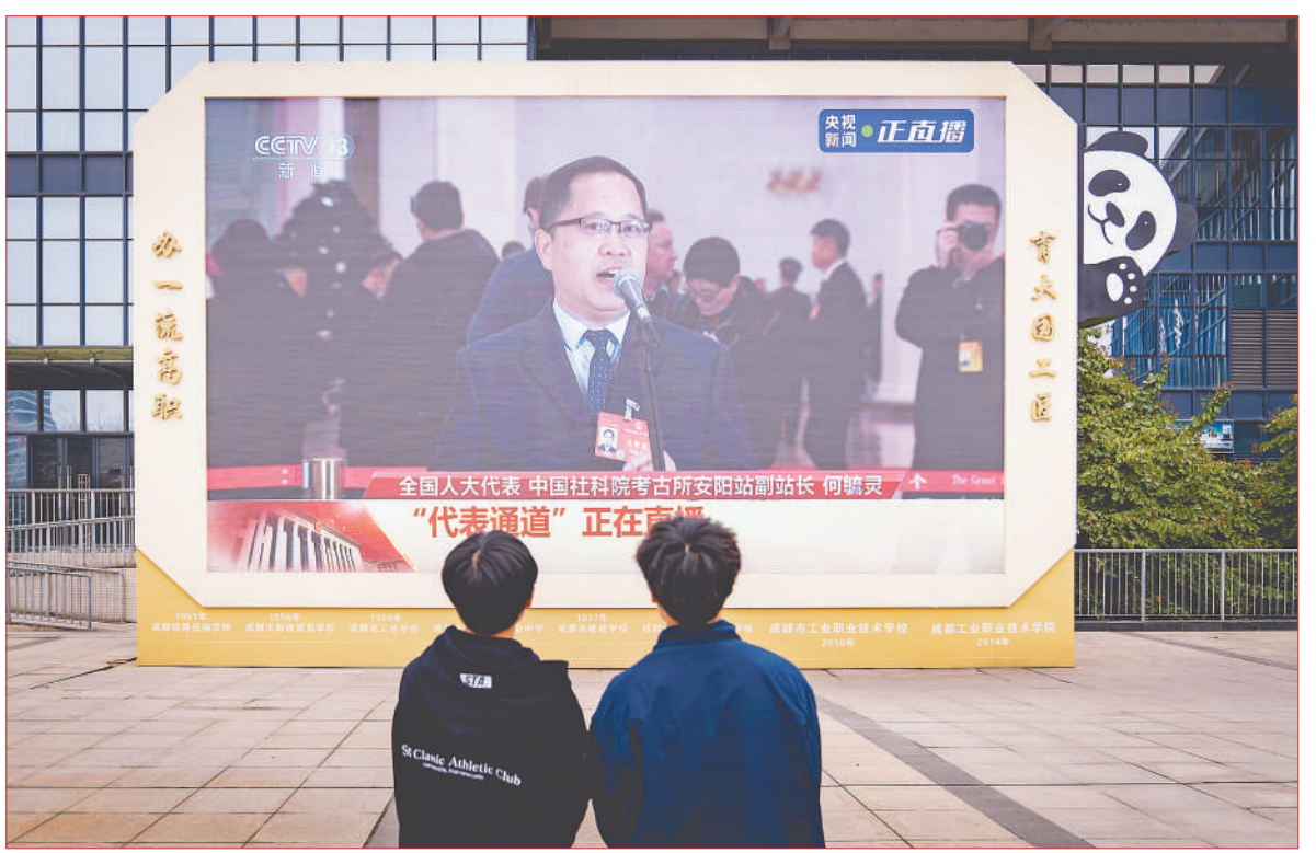
成都工业职业技术学院图书馆前，两名学生正在观看全国人大代表、中国社科院考古所安阳站副站长何毓灵在“代表通道”的发言。