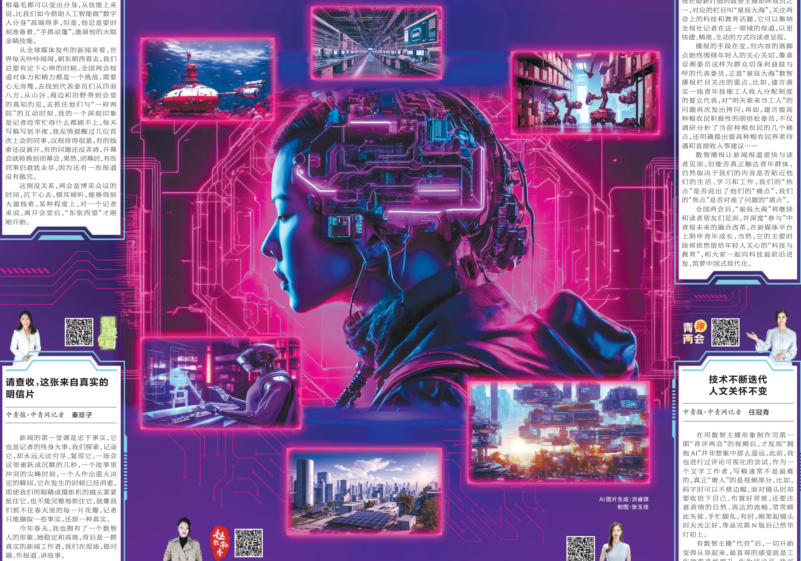
AI图片生成：洪睿琪 制图：张玉佳

带着AI上两会，绽放数智青年力。这次鲜活的实践也说明，在数智技术赋能下，评论可以以更多元、更具象的方式呈现，帮助我们触达更多读者。