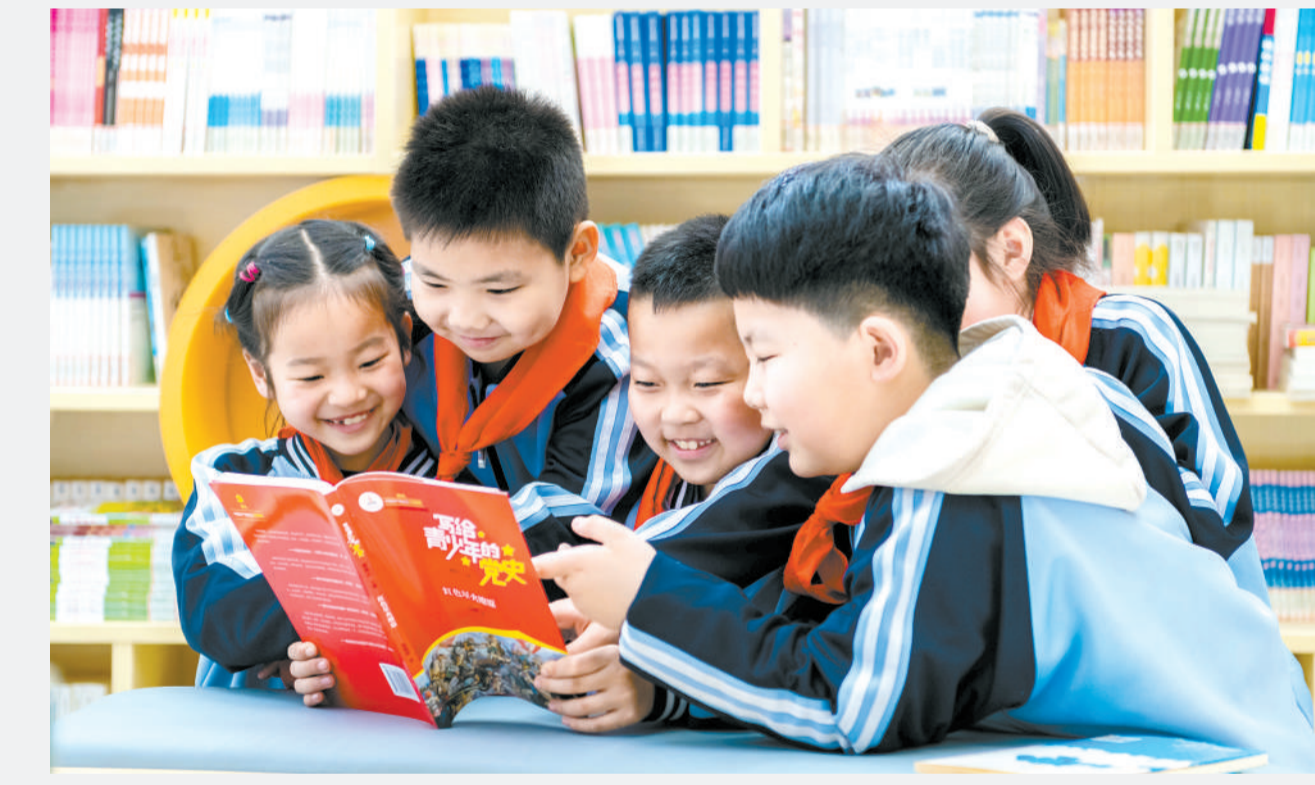
3月19日，内蒙古自治区呼和浩特市玉泉区，小学生在“思政微课堂”读书会上阅读《写给青少年的党史》。