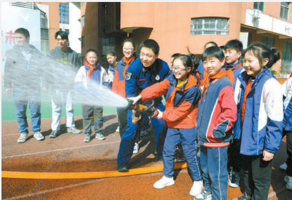
3月21日，安徽省合肥市蚌埠路第二小学，学生们在消防员的指导下学习使用多功能水枪。