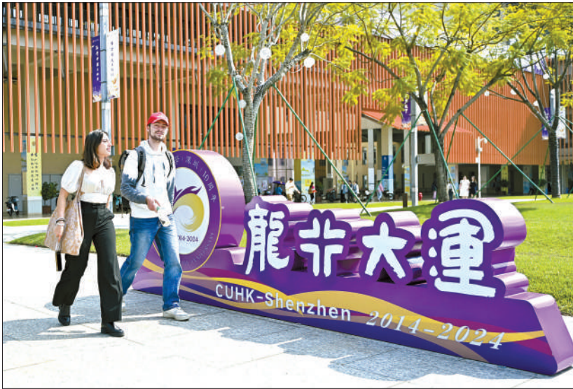
3月21日，深圳，香港中文大学(深圳)校园内的创校十周年装饰。