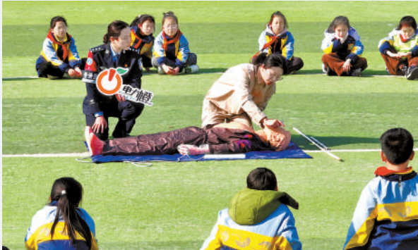
3月21日，江苏省扬州市宝应县实验小学，民警与电力志愿者为小学生进行触电急救模拟演示。