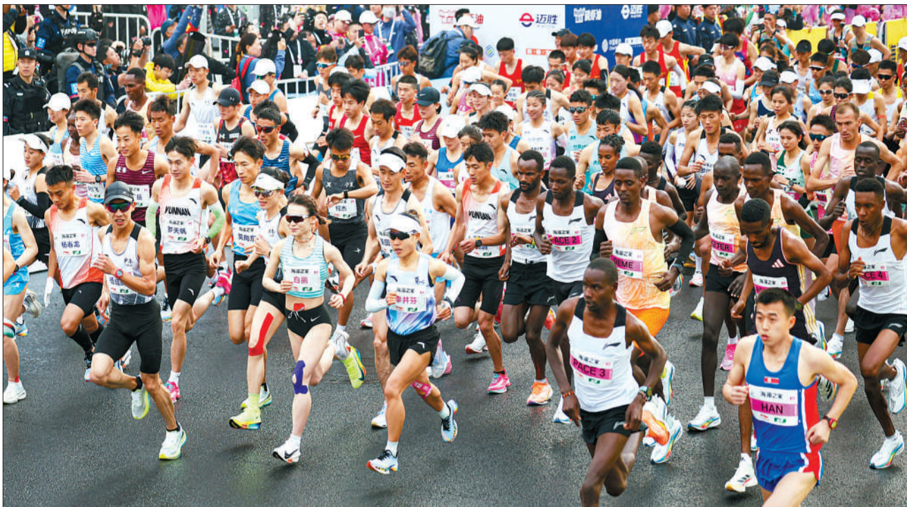
2024无锡马拉松暨巴黎奥运会马拉松选拔赛,何杰以2小时06分57秒的成绩夺得男子国内组冠军,将中国马拉松纪录再度刷新。

“风格变了,以前为了保名次,比赛方法相对保守,现在整体成绩上来了,大家都想拼一下,去冲击自己的最好成绩,这是一个方向性的变化。”何杰坦言,这一代运动员已经形成“你追我赶”的竞争态势,“强大的对手,能成就更快的自己,从而来到更快的中国马拉松”。