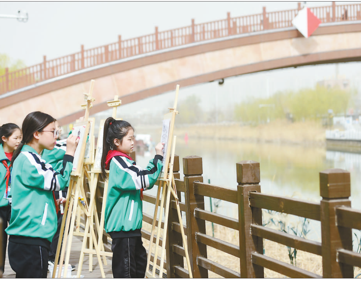
3月28日,参加公益研学活动的学生在描画运河景色。当日,由河北沧州百狮园公园、沧州中西医结合医院南川老街国医堂主办的“春到运河美,传统文化润童心”公益研学活动在古运河畔举办,孩子们通过各种方式了解运河历史,感知传统文化魅力。

躬耕教坛;完善机制体系重“奖”,营造尊师氛围重“导”,陆续设立“南开大学教育教学奖”“教学名师与教学团队奖”,关爱获评国家级教学成果、全国优秀教材、国家级一流本科课程和专业学位研究生示范课程等国家级奖励的团队与个人,最高奖励达百万元;聚焦教师队伍成长,鼓励教师参加各类教学比赛,对在高校教学创新比赛、教学基本功大赛、教师讲课比赛等全国性赛事中获得全国一等奖及以上的老师给予一次性奖励。南开大学教务部相关负责人表示,学校始终将教师作为立教之本、兴教之源。教学成果奖励体系的制定和完善,旨在通过对教育教学改革走在前列的先进单位、先进个人进行表彰,调动教师投身教育事业的主动性、创造性,鼓励更多教师全心躬耕教坛,不忘树人初心,对标南开“大先生”,争做有理想信念、有道德情操、有扎实知识、有仁爱之心、有好老师。