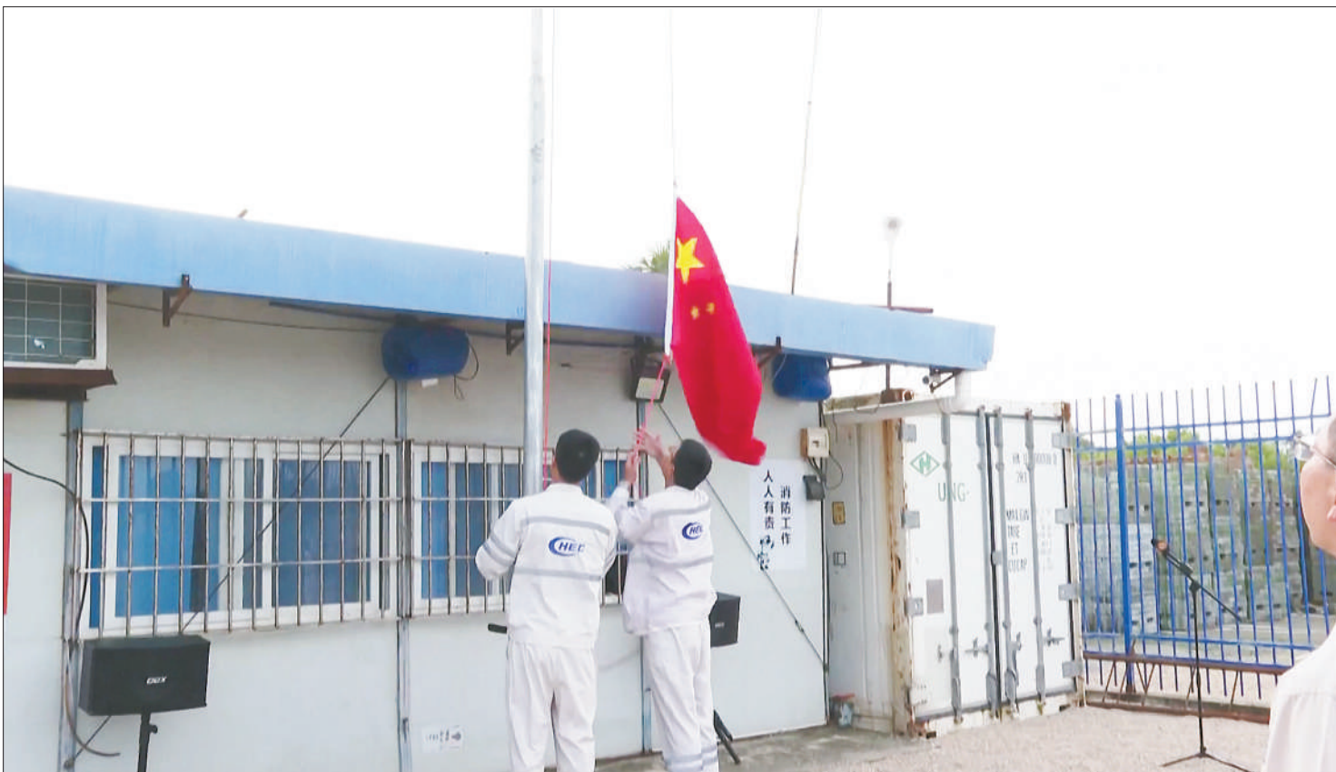
当地时间2024年1月29日早晨，中国驻瑙鲁使馆复馆小组在位于瑙鲁西南部的临时办公地点举行升旗仪式。这是时隔19年五星红旗再次在瑙鲁升起。

中方多次奉劝有关国家正视国际社会的普遍共识。中国外交部发言人林剑日前在谈及新西兰首相德格拉米尼窜访台湾时表示，斯台所