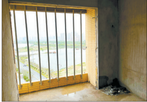
4月3日,临峰香阁3栋,一套尚未装修的4户型毛坯房,业主在强风过后给次卧窗户装上围栏。