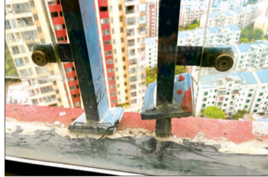
4月3日,临峰香阁3栋18层的一位业主家中,客厅阳台原本的玻璃围栏被吹坏。