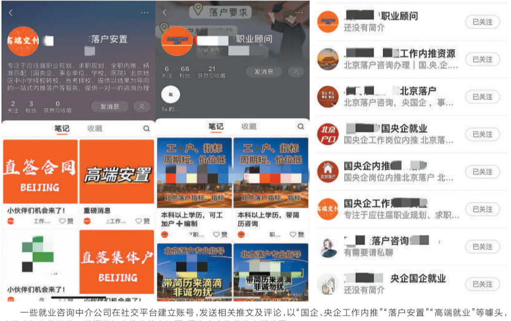
一些就业咨询中介公司在社交平台建立账号,发送相关推文及评论,以“国企、央企工作内推”“落户安置”“高端就业”等噱头,暗示求职者能以非正规渠道解决就业落户问题。图中为中介账号及主页截图。

对于求职流程中的细节,不同销售人员的说法不尽相同,前后矛盾。前面称网申笔试“靠自己”,后面又称网申“保过”;前面称笔试能提供30%题库,后面又称能拿到70%，“我们就给你往前三5名里去操作”,前面称事业单位安排成功的整体概率为50%,后面又改了说法。