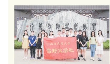
山西大同大学雪野文学社

海棠新媒体中心成立于2015年,在党委宣传部的指导下,坚持主动公开,及时发布西安海棠职业学院教育教学改革发展的重要政策、重大成果和工作动态。