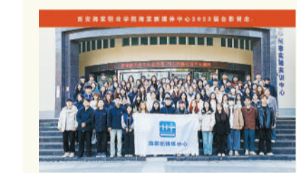
西安海棠职业学院海棠新媒体中心

山西农业大学校报记者团成立于1995年,承载着传播校园正能量、弘扬校园文化的职责,始终坚持“求真、践行”的团队理念,以“崇思、善文”为团队目标,不断团结进取。