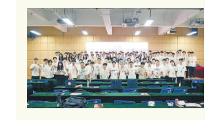
福建理工大学RC机器人协会

山西大同大学雪野文学社于1986年由洪海文学社和五月诗社合并成立,是山西历史最悠久的文学社团之一,每年举办征文比赛、文学沙龙等,出版社刊《绿岛》20余期。