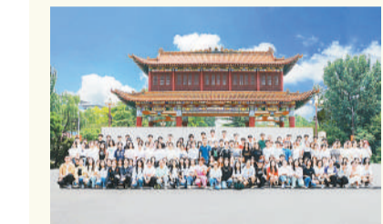
山西农业大学校报记者团

天津大学新媒体中心是天津大学党委宣传部指导下的育人实践基地,负责运营天大官方微信、微博、头条号、百家号等10余个天大官方新媒体账号,实践基地师生齐心协力推动校园网络文化建设。