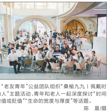
“老友青年”公益团队组织“桑榆九九”佩戴时间的人”主题活动,青年和老人一起深度探讨“时间的增值或贬值”“生命的宽度与厚度”等话题。

“在这里,青年不是傲慢的后生,是虚心求教敬重前辈的后辈;老友不是古板的“老顽童”,是跟随新时代一同成长的“老顽童”。