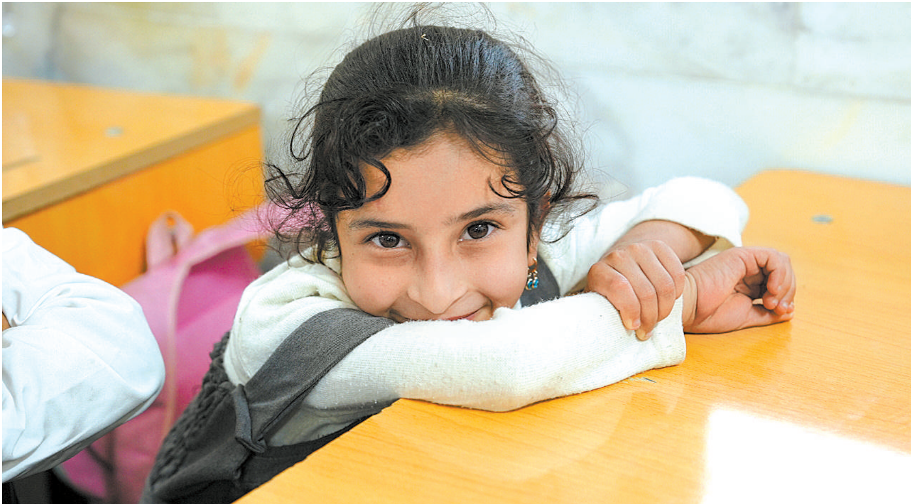
在振华希望学校的教室里，一名当地学生坐在课桌前，面带笑容地望向镜头。