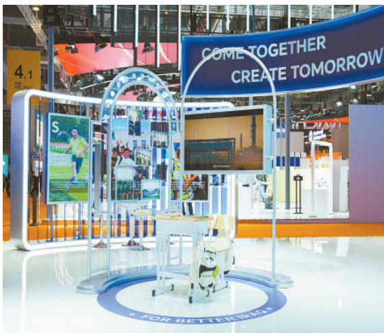
第八届进博会兵器工业集团振华石油展区现场，来自伊拉克振华希望学校的一张教室课桌。