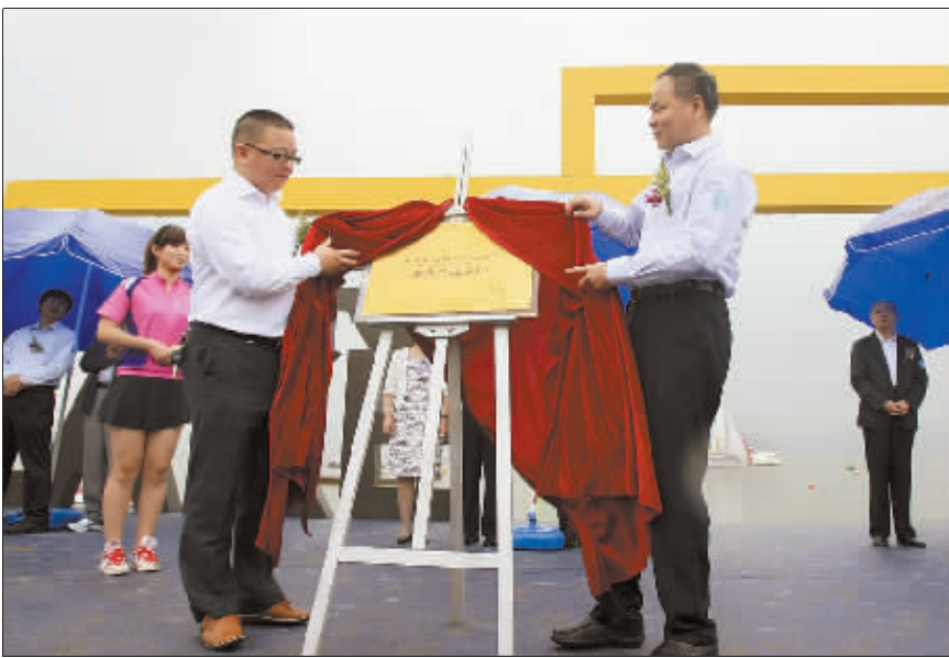
9月22日,第四届中国湖泊休闲节开幕式现场,中国婚庆产业联盟集团代表与东钱湖管委会领导为东钱湖户外婚庆产业基地揭牌。