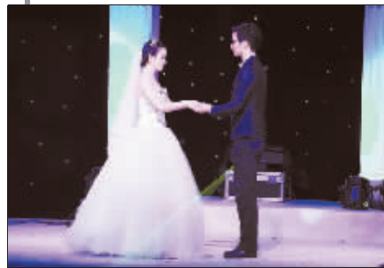
9月22日晚,“婚纱里的东钱湖”草坪主题婚礼秀现场,新郎与新娘双手相握。

新郎手捧鲜花缓缓走向舞台,等候新娘到来。新娘走过白毯铺就的30米草坪,穿过搭建的白色拱门,与新郎相向而来,直到牵手相携。新郎望着新娘,单膝跪地,递过捧花。新人