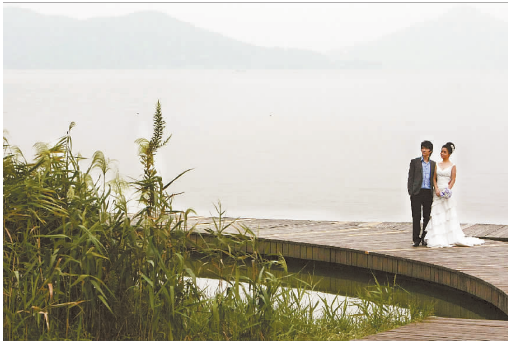
9月21日,一对新人在东钱湖边的木制栈道拍摄婚纱照。

说,未来将在东钱湖新城、南湖岸线两大片区,重点培育运河酒店、启新绿色世界高尔夫俱乐部、阳光沙滩、游艇俱乐部等婚庆景区。