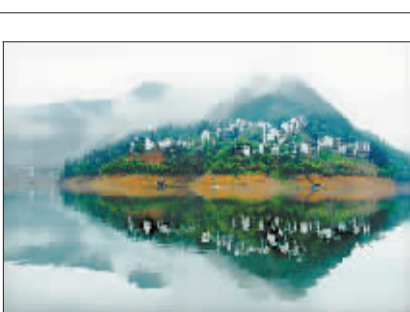
潜口民宅清园晨曲