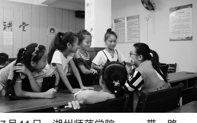
7月11日，湖州师范学院一带一路一实践，共兴共赢共发展暑期社会实践团队，走进湖州市陌二社区，向小学生们普及丝绸之路相关知识。