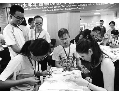
四川大学每年7月都会举办国际课程周，邀请来自国外各个大学与专业的教授和学生与川大学生共同学习、交流。图中是2017年的国际课程周，由华西临床医学院主办的Knock Your Brain中外医学生对抗赛，他们将香蕉当成皮肤练习缝合术，比拼医学专业技能，既考验实践操作，又充满乐趣。