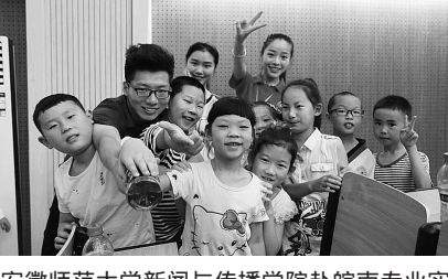
安徽师范大学新闻与传播学院赴皖南专业实践团队在徽州地区青少年宫开设传媒素养普及培训班，进行义务支教。在课间小朋友和大学生合影留念。