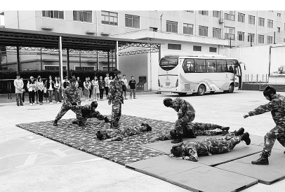
在建军90周年来临之际，华东政法大学学生走进上海武警总队二支队五中队军营，与同龄武警战士共同回顾和学习建军90周年光辉史。