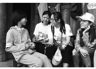
上海商学院爱心贵州社团第7年走进大山，实地走访贵州贫困家庭学生，进行一对一精准帮扶计划。