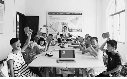
7月7日，浙江师范大学筑梦支教暑期社会实践团队，为武义县暑期公益夏令营的小朋友开展听党史、画党徽主题活动。