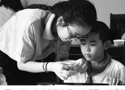
7月12日，安庆师范大学启明星关爱留守儿童暑期社会实践团队，在安庆市大龙山镇桃元社区开展支教活动。手工课上，大学生正在教小朋友折纸。