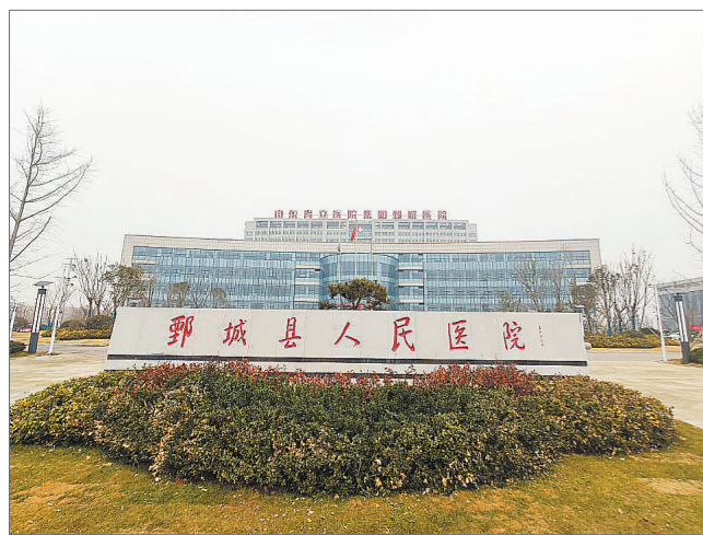
鄞城县人民医院的新院区。

无论是鄞城县的人社部门还是县人民医院等用人单位都坦承，他们打的是亲情牌。从经济方面来说可能是没有什么大的吸引力。但是从家庭、从亲子关系上打动他们。工作方便、生活方便，希望从这一块留住他们。