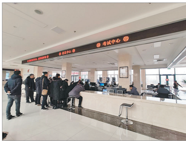
2019年12月，在鄞城县人社局排队办理业务的人们。