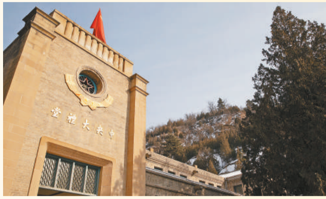
2018年1月15日 陕西延安杨家岭,中共七大会址中央大礼堂。