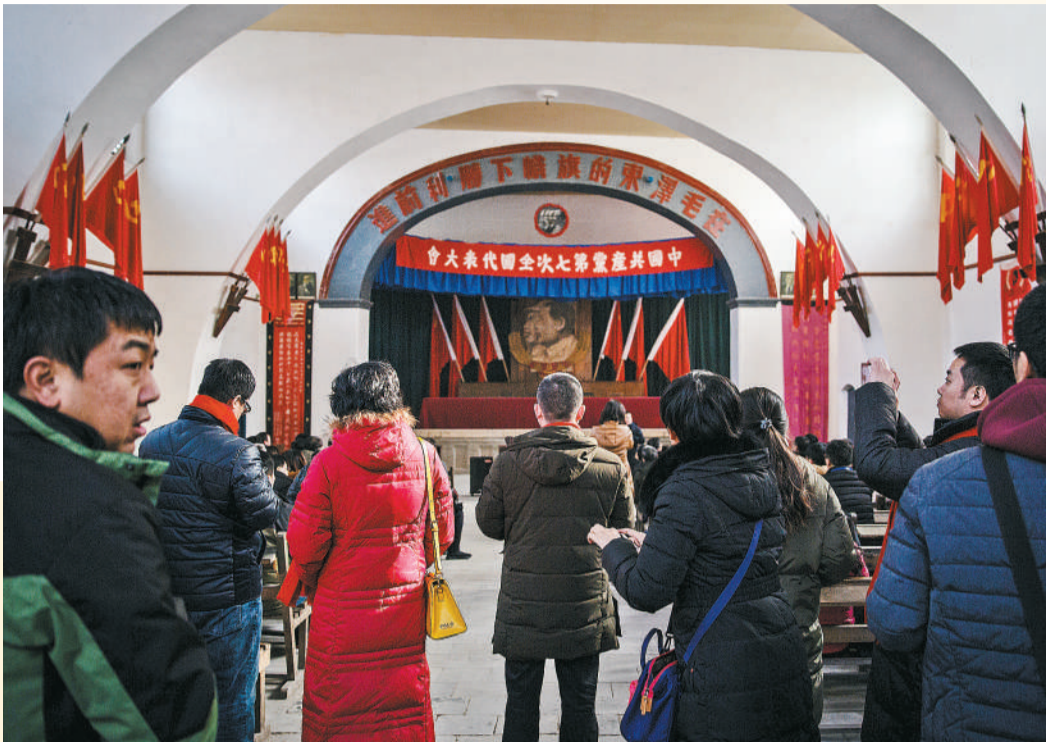
2018年1月15日 陕西延安杨家岭,中共七大会址中央大礼堂内,一场关于党史的讲解刚结束,前来参观学习的人们在离开前合影留念。