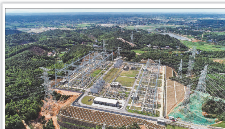
俯瞰2020年长沙电网630攻坚一号工程500千伏望城变电站项目

锤炼一流队伍。深入推进“三项制度改革”，以优化队伍结构、提升队伍素质、激发队伍活力为抓手，以构建高效组织用工体系、升级人才培养模式、强化管理机制价值导向为手段，打造一支结构均衡、梯次有序、能力突出、作风过硬的高素质人才队伍。