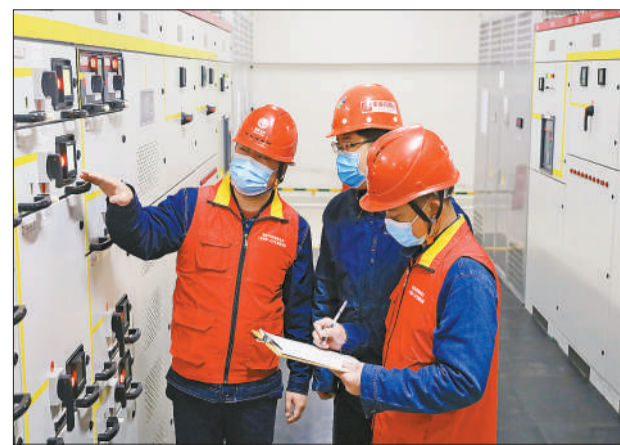
复工复产忙，电雷锋 主动走访企业用户，优化用电服务方案