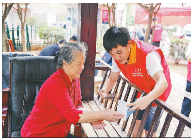
你用电我用心，电雷锋 向用户宣讲安全用电常识和网上办电业务