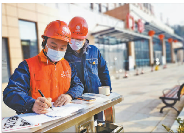
电雷锋 深入防疫一线，争分夺秒为定点医院增容送电