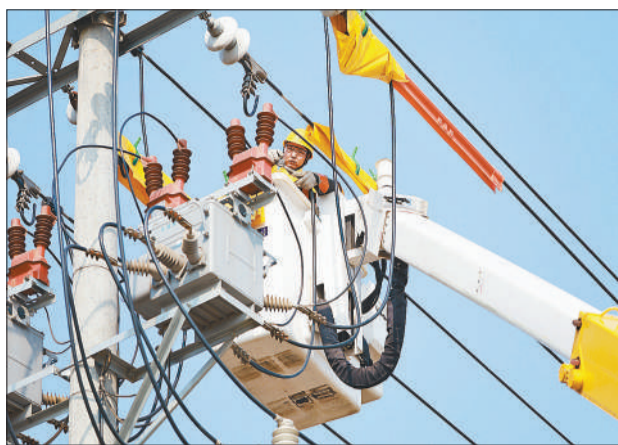
与电共舞，电雷锋 正在开展带电作业