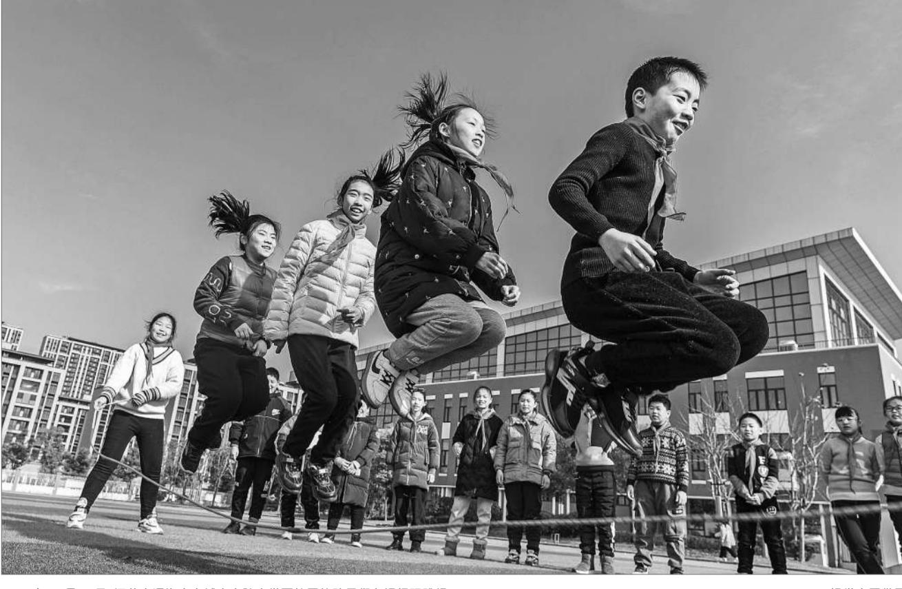
2020年12月16日,江苏南通海安市城南实验小学西校区的孩子们在课间玩跳绳。

而根据南通市过去两年的学生体质监测数据,在 方案 未出台的情况下,小学毕业生的体质测试合格率也达到了90%以上。杨浩以此让焦虑的家长们宽心,只要孩子保质保量上好体育课和参加每天一小时的体育活动,就不太可能在小学毕业生体质测试过程中不及格。无论是从测试及格的难易程度看,还是从是否需要给孩子报体育类课外培训班看, 方案 都没有给孩子增负的意思。 为了让孩子们能在小学毕业生体质测试中顺利过关,家长必须关注学校是否开齐、开足、上好体育课。王宗平表示,正如不久前全国人大代表、江西省委教育工委书记叶仁荪在两会上提出,建议开展中小学体育晒课活动,一样,体育课需要通过晒课表,来接受家长监督。因为存在两张课表的学校(课表一是对外的,课表二是实际执行的)在全国绝不是少数。当家长们知道,学校肆意占用体育课将会直接影响到孩子获得小学毕业证时,也将自然承担起学校体育工作的监督者角色。 那么,为什么是南通成为全国第一个将学生体质测试结果与小学毕业证挂钩的地区? 杨浩表示,南通此次 方案 的出台,依据的政策分别是2019年7月发布的《中共中央国务院关于深化教育改革全面提高义务教育质量的意见》和江苏省委、省政府在去年出台的《关于新时代推进基础教育高质量发展的意见》。两个《意见》均明确规定,除了体育免修的学生之外,未达体质健康标准的,不得发放毕业证书。 《中共中央国务院关于深化教育教