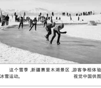
这个雪季,新疆赛里木湖景区,游客争相体验冰雪运动。