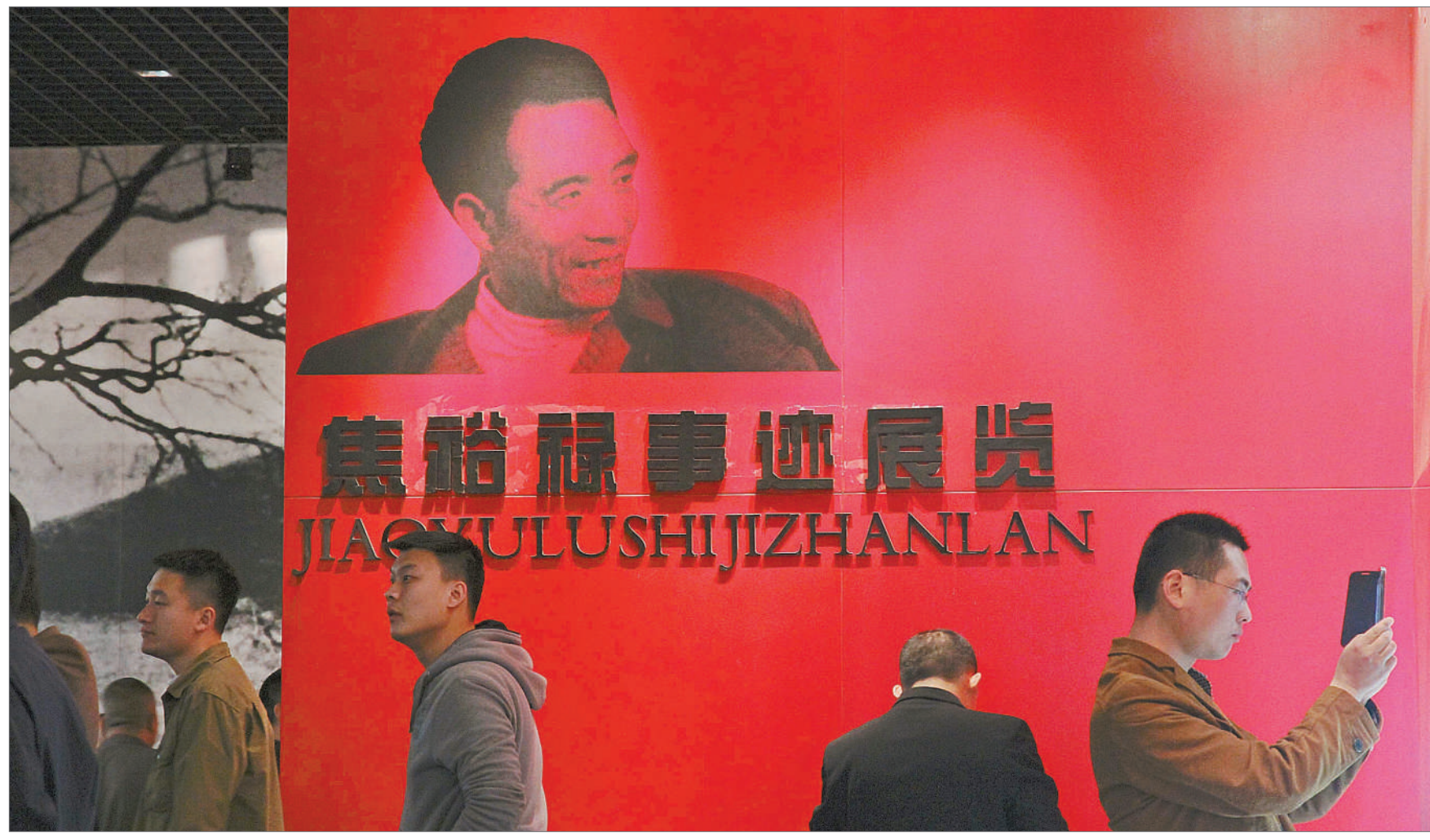
2014年4月2日，来自全国各地的党员干部在河南省开封市兰考县焦裕禄同志纪念馆参观学习。