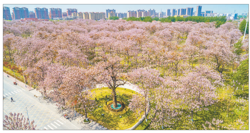
河南开封，泡桐花盛开的季节，美不胜收的焦桐与泡桐林。

魂飞万里，盼归来，此水此山此地。百姓谁不爱好官？把泪焦桐成雨。生也沙丘，死也沙丘，父老生死系。暮雪朝霜，毋改英雄意气！依然月朗如昔，思君夜夜，肝胆长如洗。路漫漫其修远矣，两袖清风来去。为官一任，造福一方，遂了平生意。绿我涓滴，会它千顷澄碧。