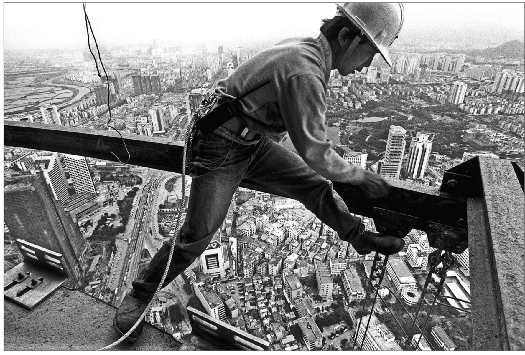
1995年6月5日，高度383.95米的深圳地王大厦即将封顶。这座建筑的高度当时居世界第四、亚洲第一。