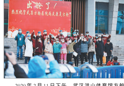
2020年2月11日下午,武汉洪山体育馆方舱医院东门,首批出院的患者与医护人员、工作人员合影。