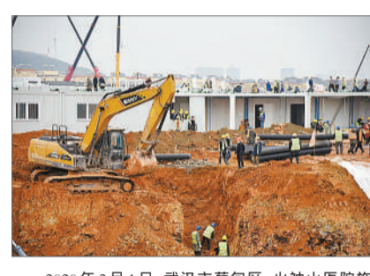
2020年2月1日,武汉市蔡甸区,火神山医院施工现场。当天,火神山医院项目场地基础施工全部完成。