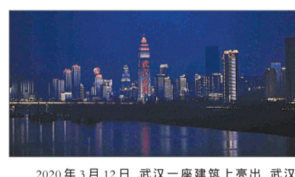
2020年3月12日,武汉一座建筑上亮出武汉必胜字样。