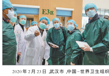
2020年2月23日,武汉市,中国-世界卫生组织新冠肺炎联合专家考察组访问同济医院(光谷院区)院方向考察组介绍院区的整体情况。