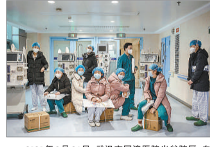
2020年2月26日,武汉市同济医院光谷院区,血液净化中心的护士们等待即将到场的援助物资。