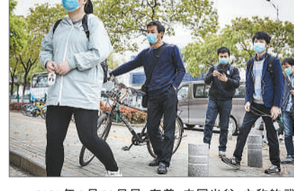
2020年3月23日早,有着中国光谷之称的武汉东湖新技术开发区,一家光纤光缆公司外,等待检测体温的员工。这是他们开始复工后的第一个工作日。