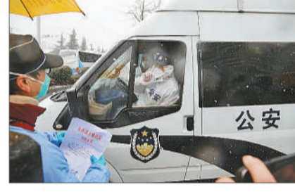
2020年2月15日,武汉东西湖方舱医院,一辆载有治愈患者的车开出医院。