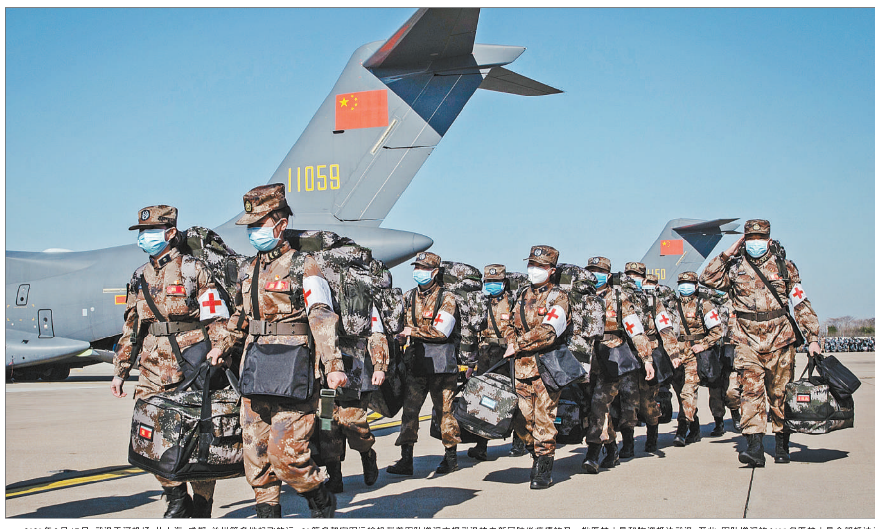
2020年2月17日,武汉天河机场,从上海、成都、兰州等多地起飞的运-20等多架空军运输机载着军队增派支援武汉抗击新冠肺炎疫情的又一批医护人员和物资抵达武汉。至此,军队增派的2600名医护人员全部抵达武汉。本批1200名医护人员和医疗物资,分别通过航空和铁路输送抵达武汉。