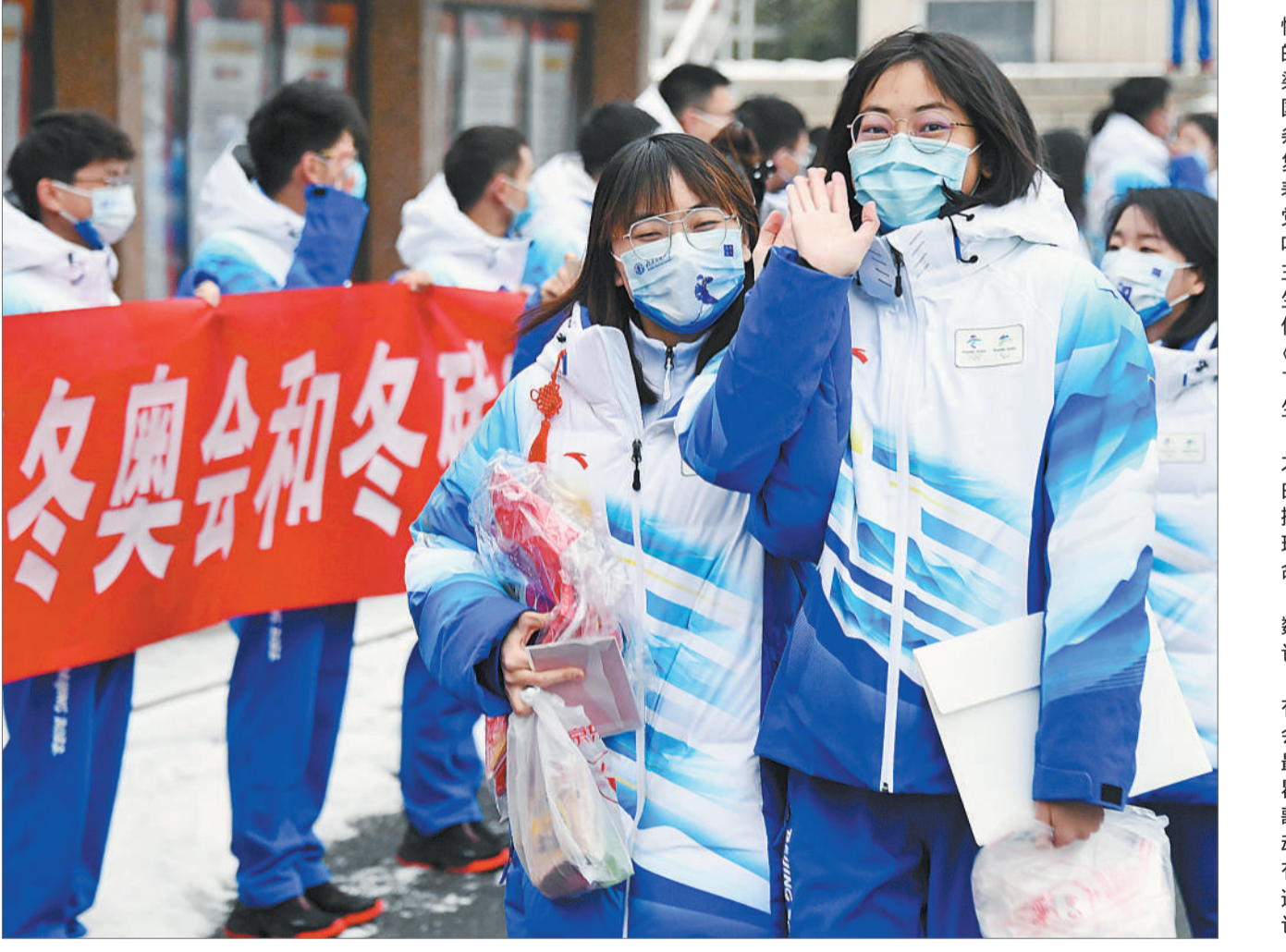
1月23日，在北京交通大学，首批冬奥志愿者准备出发。据了解，首都高校将有1.4万名师生作为赛会志愿者，为2022年北京冬奥会（冬残奥会）提供保障服务。志愿者入驻地当天，首都高校志愿者共上一堂“冰雪上的思政课”，冬奥冠军王春露以《我和我的祖国》为主题，普及冰雪运动常识，讲述为国争光的拼搏故事。