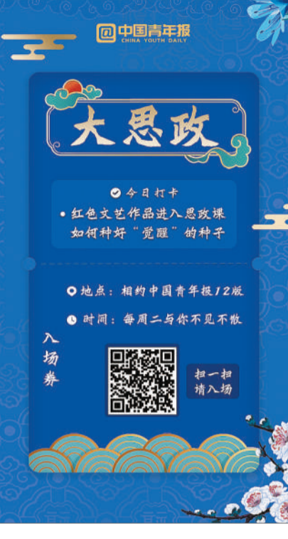
中青报 中青网记者 沈杰群 梅潇予 视频制作 沈杰群 余冰珂

最近，在剧集基础上进行艺术加工的同名长篇历史小说《觉醒年代》出版。龙平坦言，这部剧播出前，他有点儿犯迷糊，自己60多岁了，也不知道年轻人现在究竟是怎么想的。 龙平说：年轻人究竟需要什么？我在写作的时候没有一个非常清晰的判断，也没有迎合年轻人的想法。但是我知道，如果年轻人不喜欢，就是失败。 播出后，网友们的观剧热情，让龙平学会了一些很新潮的网络词汇，比如弹幕、催更。触动他的，还有网友们一句句用真情实感写下的剧评：我们的考点，是他们的一生。他们最先醒来也最先离去。延乔路的尽头是繁华大道。