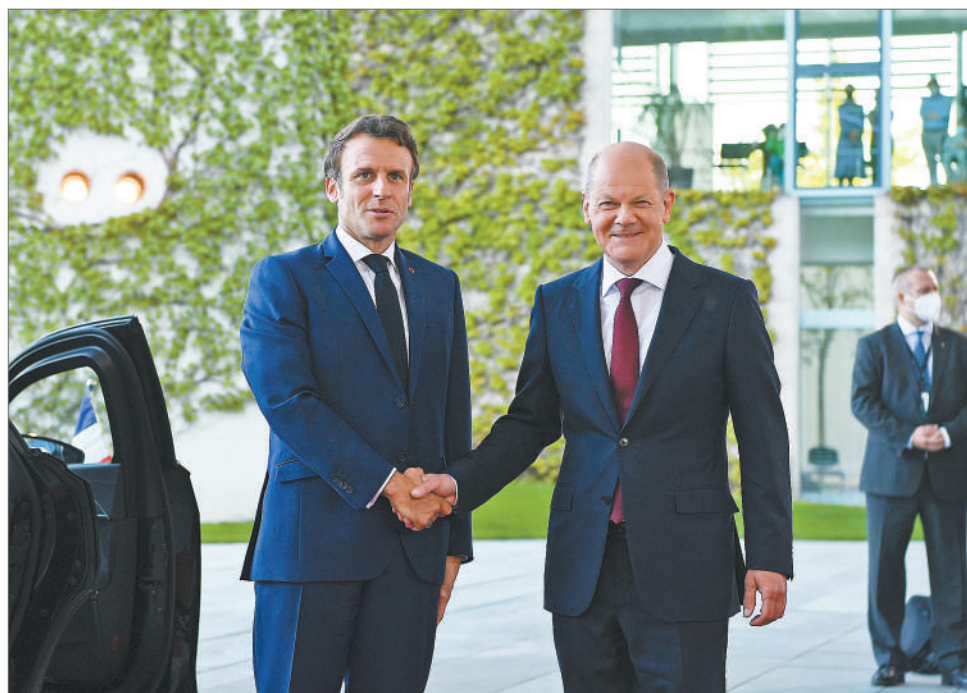
5月9日，德国总理朔尔茨(右)在柏林同来访的法国总统马克龙举行会谈，双方强调要在强大、自主的欧洲框架内共同应对时代挑战。