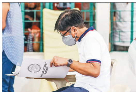
5月9日，菲律宾总统候选人小费迪南德·马科斯在菲律宾北伊罗戈省的一处投票站参加投票。计票结果显示，小马科斯和他的搭档、现总统杜特尔特的女婿莎拉大获全胜。

在代帆看来，小马科斯的整体政策取向，将仍然是以经济发展为导向。要回应大众对他的期望，小马科斯必须振兴菲律宾经济，因此他不会把安全问题作为优先选项。在经济领域，如振兴旅游业、推进基础设施建设、推动劳务出口、发展农业经济和能源保