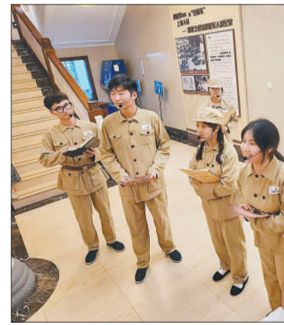
学生们在华政交谊楼内演出解放军解放上海前的一幕。