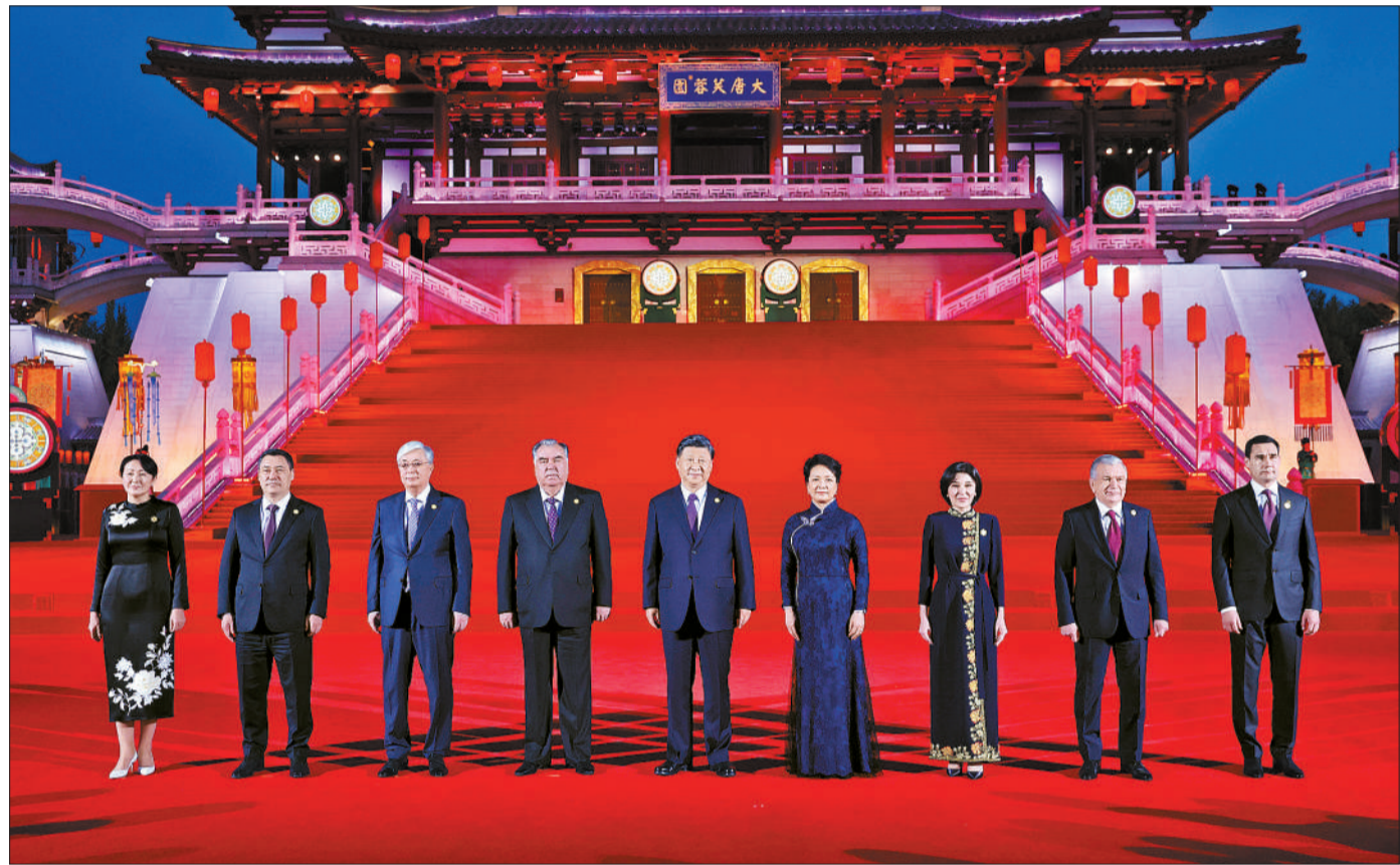
5月18日晚，国家主席习近平和夫人彭丽媛在陕西省西安市大唐芙蓉园为出席中国-中亚峰会的中亚国家元首夫妇举行欢迎仪式和欢迎宴会。这是习近平发表欢迎致辞，代表中国政府和中国人民热烈欢迎中亚各国元首。