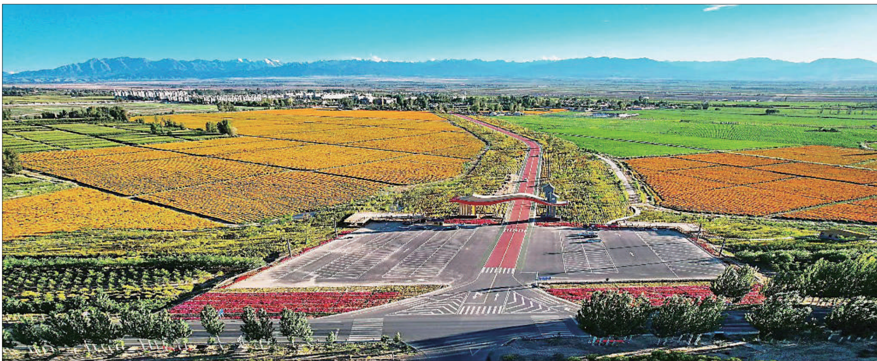
甘肃省张掖市民乐县现代丝路田园综合体。