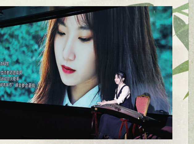
10月25日，“真青春·活出彩·书香为伴·梦想启航”活动，两岸青年以演讲的形式分享自己与读书的故事。