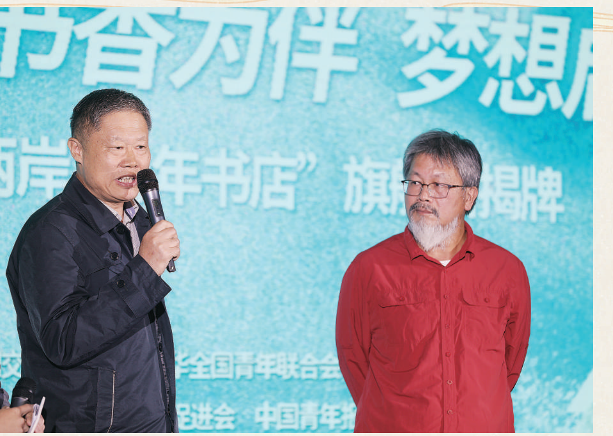
10月25日，“真青春·活出彩·书香为伴·梦想启航”活动现场，中国报告文学学会副会长李青松(左)和台湾知名作家蓝博洲作为特邀嘉宾，分别发言。