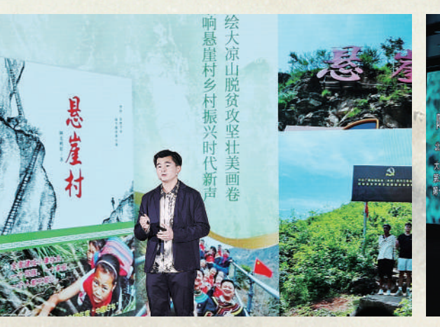
10月25日，“真青春·活出彩·书香为伴·梦想启航”活动，两岸青年以演讲的形式分享自己与读书的故事。