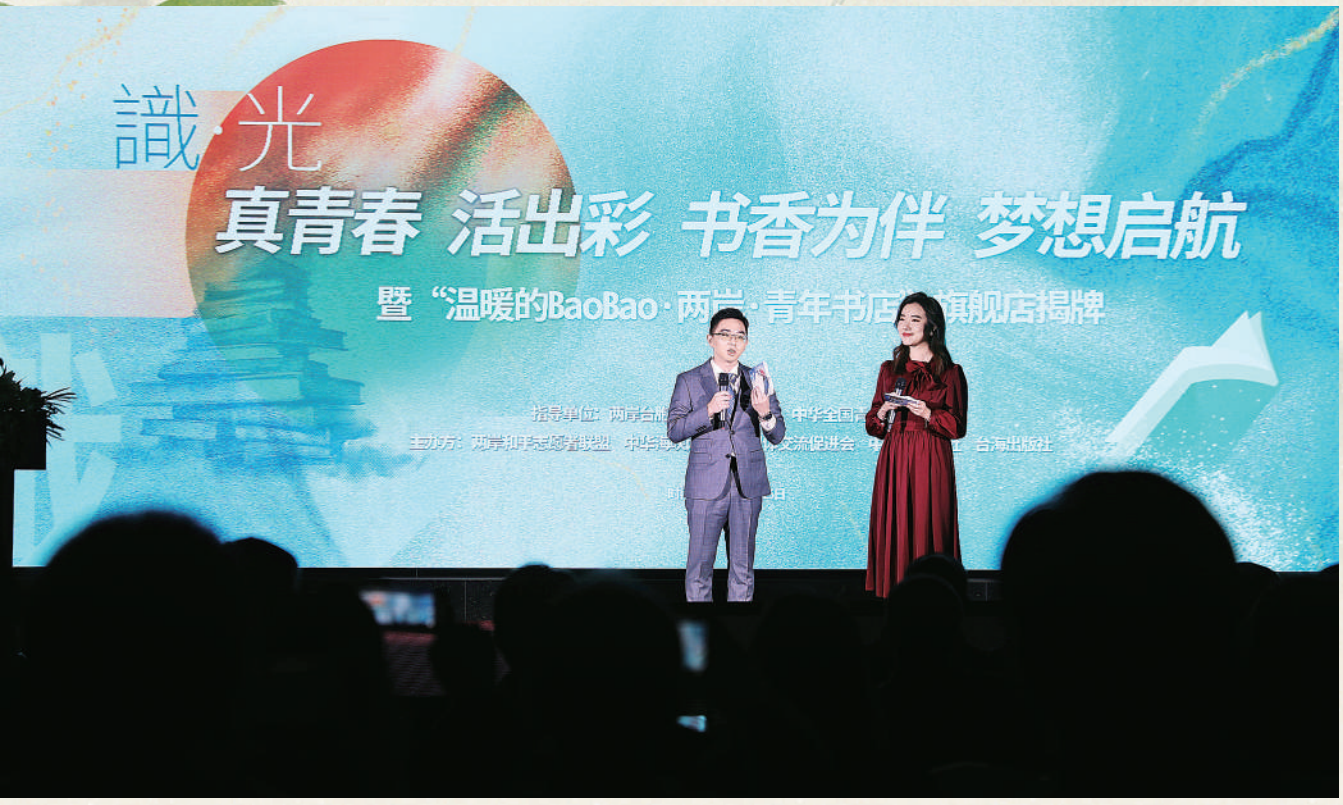
10月25日，“真青春·活出彩·书香为伴·梦想启航”活动现场，两岸青年在分享会上交流。