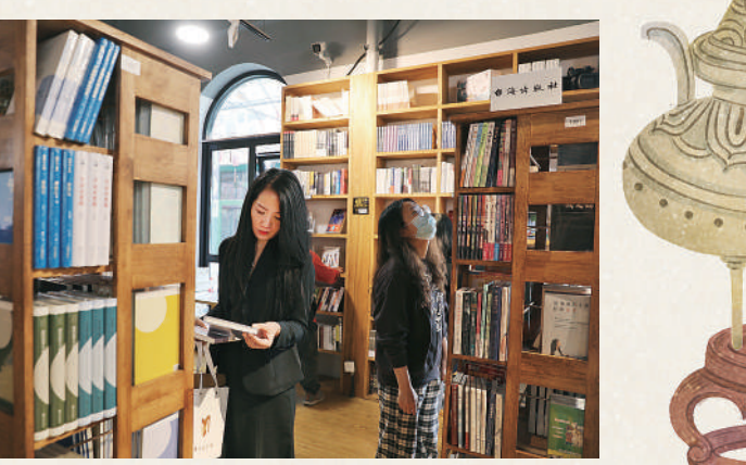
10月25日，位于北京前门大街附近的温暖的Baobao·两岸·青年书店内，两位友人在书店前驻足。