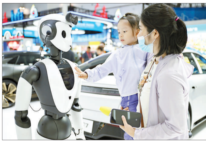
4月15日,观众在消博会上与AI人形智能服务机器人互动。

4月16日上午,一名观展商还在该展位询问能否在马来西亚本地买到适配当地语言的产品。