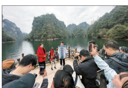
3月10日，湖南张家界，机器人“笨笨”出现在湖南张家界景区，游人争相拍照。