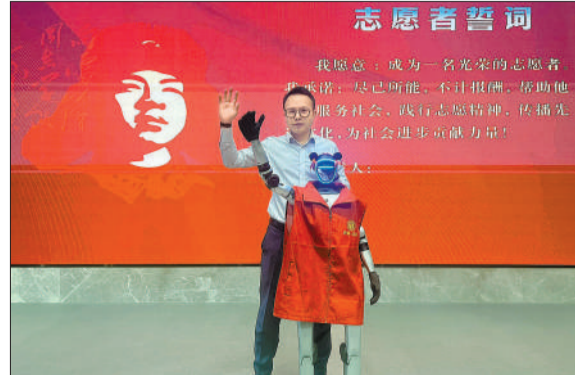
2月28日，湖南长沙，机器人“笨笨”注册成为湖南长沙首位机器人雷锋志愿者。