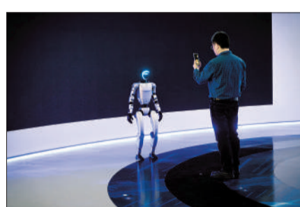
3月3日，北京石景山，宇树G1。

个机器人界的“顶流”正在诞生。 另一个市场对宇树机器人也反响强烈——股市。宇树机器人的关节轴承供应商商盛轴承的股价涨幅一度超过400%，许多供应商的股价都涨停。 然而，当高盛集团调研过宇树后，在一份调研报告中表示，宇树硬件表现亮眼，但人形机器人技术拐点仍不明朗，距离真正“上岗”还有很长的路要走时，相关股票又应声大跌。 在现实中，许多人发现，原来宇树机器人主要是靠遥控器操纵的，但在宇树官方发布的视频里，观众很少能看到遥控器的存在。 雷勇林上手操作后也发现，G1跟自己的期待有一些落差。当他把它从箱子里搬出来时，像在搀扶一位烂醉如泥的人，“它的70斤比人的70斤重多了”。它能做的动作并不多，也无法进行语音对话，像个哑巴。它的脚步声也很响，以至于雷勇林担心楼下的邻居会投诉。