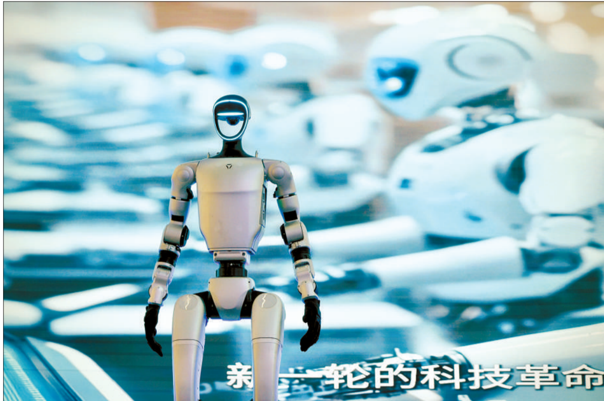
3月3日，北京石景山，一台工作日兼职、周末打工的宇树G1。