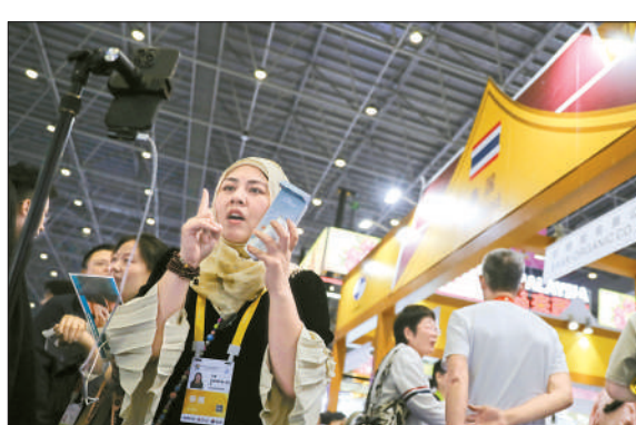
4月13日，海南海口，海南国际会议展览中心，第五届消博会全球特色消费展区，一名泰国海南贸易公司协会的参展商在直播带货。