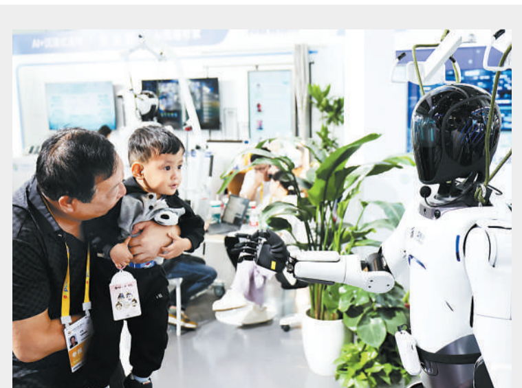
4月14日,在第五届消博会上,小朋友与中国移动展出的机器人互动。第五届国际消费品博览会聚焦未来科技,各式各样的机器人纷纷亮相,以前沿科技实力与创新应用,勾勒出未来生活的全新图景。