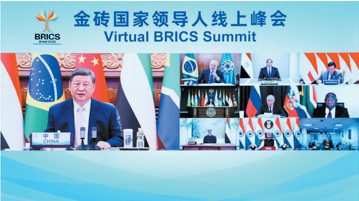
9月8日晚，国家主席习近平出席金砖国家领导人线上峰会，并发表题为《团结合作 砥砺前行》的重要讲话。

新华社北京9月8日电(记者杨依军 邵艺博) 9月8日晚，国家主席习近平出席金砖国家领导人线上峰会，并发表题为《团结合作 砥砺前行》的重要讲话。