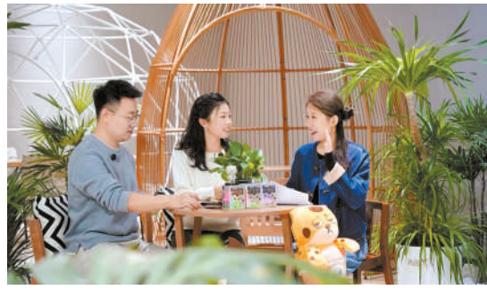
“Bao你脱单”栏目直播间。