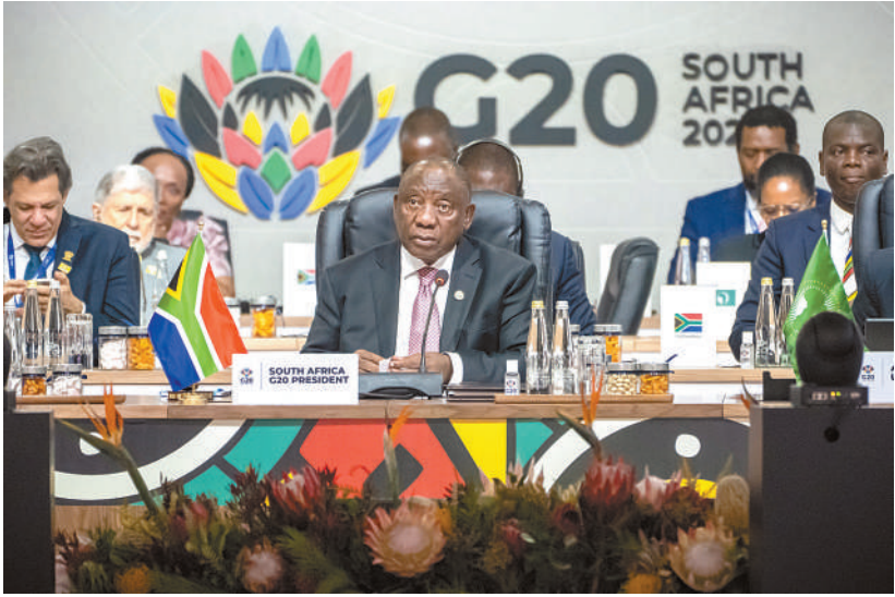
11月23日，南非约翰内斯堡，南非总统西里尔·拉马福萨在二十国集团领导人峰会上发表讲话。