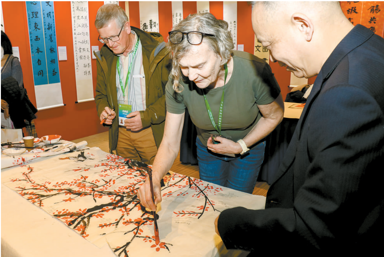
在2025世界中文大会的文化体验区，一位外国嘉宾正专注地用毛笔在宣纸上绘制红梅。